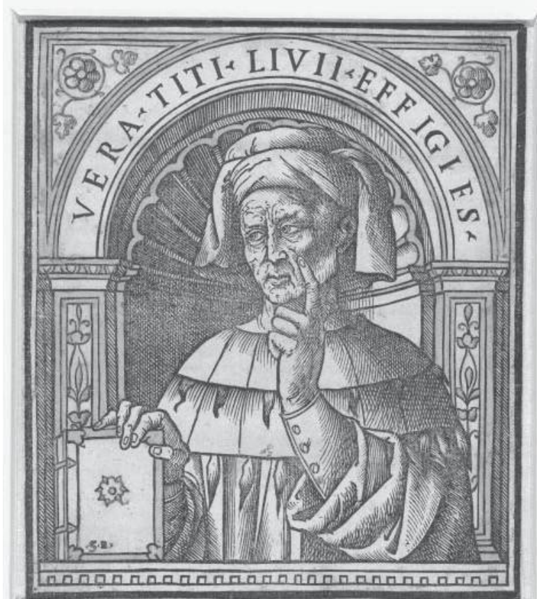
ПОРТРЕТ ТИТА ЛИВИЯ. ДЖОВАННИ АНДРЕА ВАВАССОРЕ

XIV. (31) Но самый лучший довод – это безмолвное сви-