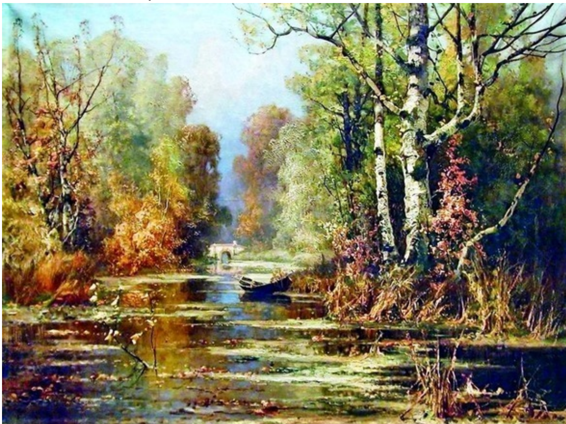
Юлий Клевер (1850 – 1924) Осенний парк

Создано в интеллектуальной издательской системе Ridero