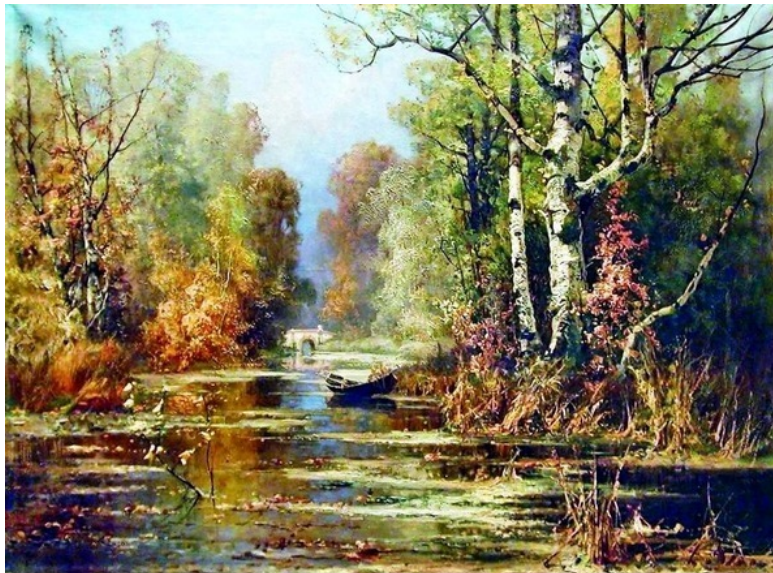
Юлій Клевер (1850 – 1924) Осінній парк

Хочу Вам розповісти про надзвичайно красиве місце, що знаходиться поруч з нашим будинком. Живу я в Санкт-Петербурзі, відомому своїми архітектурними ансамблями, палацами, театрами і музеями, які, в основному, знаходяться в центральній історичній частині міста. Але місто постійно розширюється і його нові споруди часто будуються в оточенні незайманих лісових масивів, перетворюючих у місця відпочинку для жителів цих районів.