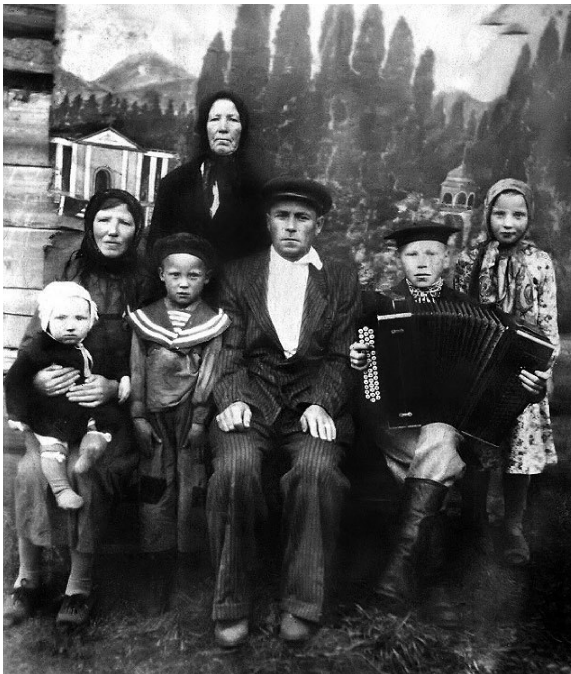
Трёхпоколенная семья в Водлозерах. 30-е годы XX века

Статусное положение молодежи в патриархальной семье, как следует из ранее сказанного, в силу близости по степени кровного родства к главе семьи почти всегда было выше, чем у молодой снохи и даже молодого зятя-примака. Юноши в традиционной крестьянской семье уже исполняли работу взрослых мужчин, девушки были способны работать не хуже, чем снохи. Общественный же их статус был ниже, чем у примаков и снох, поскольку в браке они еще не состояли. При этом юноши чувствовали себя более свободными от родительской опеки, поскольку за девушками в патриархальных семьях надзор был не в пример строже (Там же, с. 94–95, 97; Русские, 1997, с. 459–461). Общественный статус молодежи в деревне во многом был связан с индивидуальной репутацией (Громько, 1986, с. 109), зарабатываемой личным отношением к труду и примерным поведением в личной, общесемейной и общественной жизни.