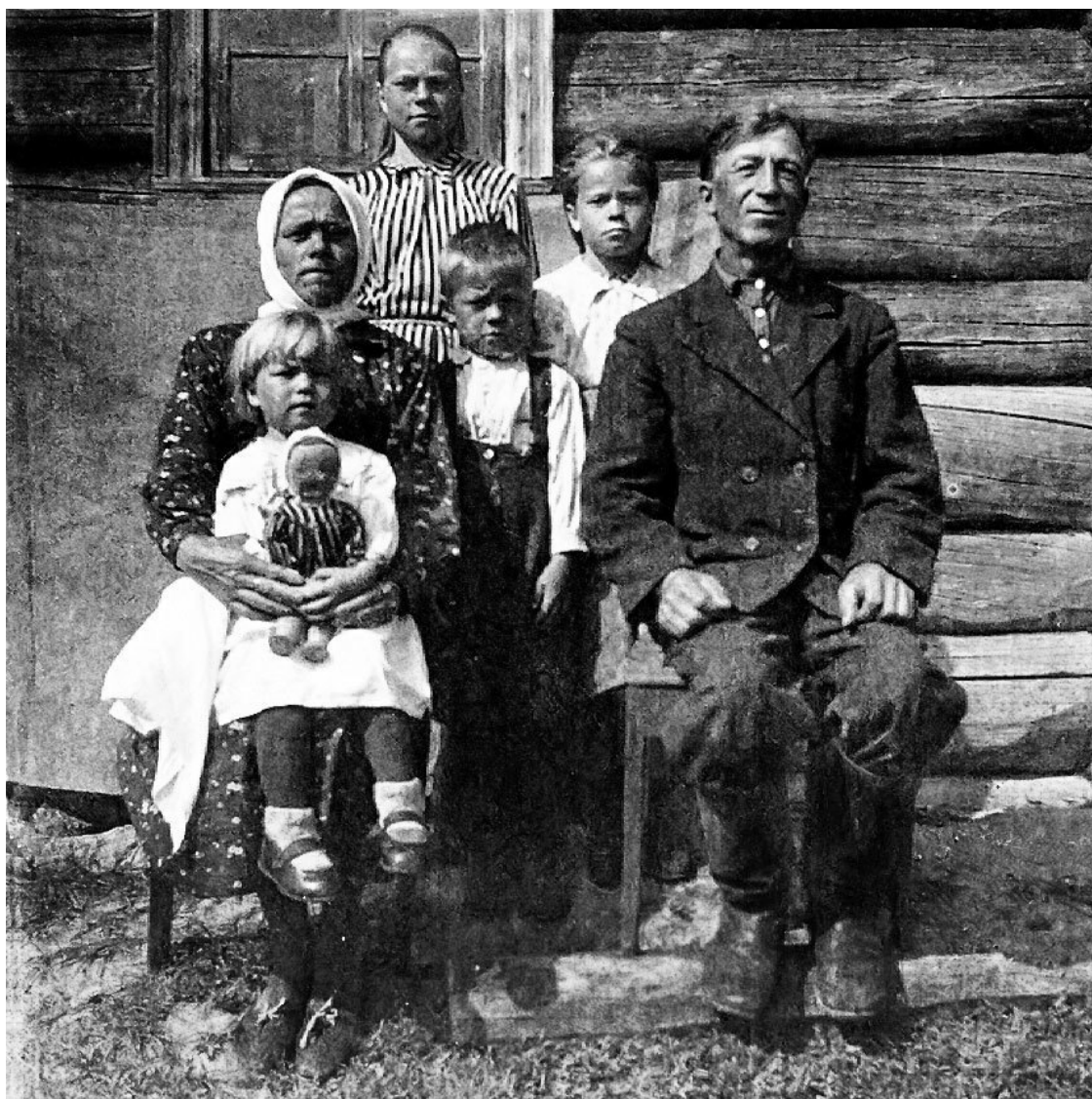
Семья водлозёров (д. Калакунда, 1930-е гг.).

малой семьи. В сложных семьях понятие «родня» могло включать также родственников боковой линии (двоюродных и троюродных), проживающих под общей крышей и ведущих совместное хозяйство, а также и свойственников. В широком смысле слова понятие «родня» включало весь семейный клан. В собственно терминологии родства и свойства водлозеров почти нет ничего оригинального. Можно отметить лишь термин «свись», который иногда применялся в отношении сестры жены, т. е. свояченицы (НАКНЦ, ф. 1, оп. 6, д. 628, л. 22). Прадеда в Водлозерье именовали «правдедом», правнуков – «правниками», жену дяди – «дяиной», дядю – «дией», двоюродных братьев – «братанами», крестную мать – «крестнухой». Подобная терминология родства и свойства в прошлом была присуща системам родства и свойства русских практически всего Русского Севера.