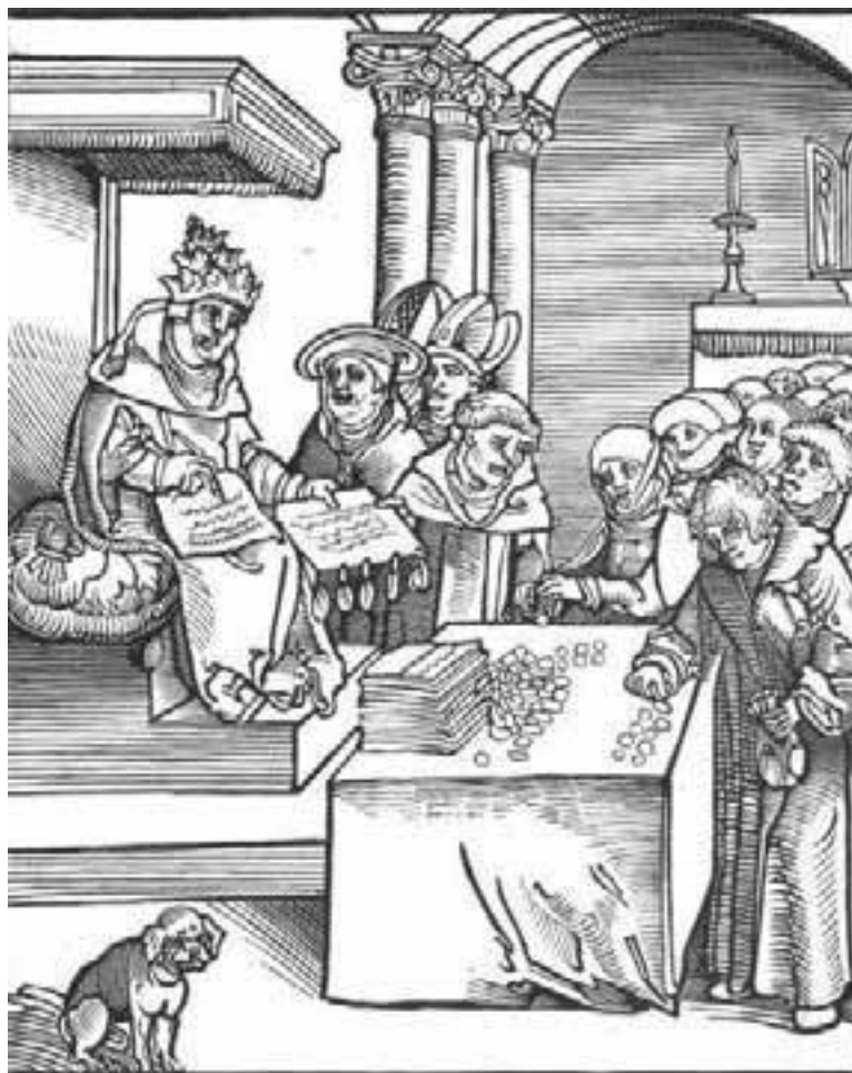
«Антихрист» Лукас Кранах-Старший

Со временем люди (в первую очередь, христиане) стали понимать, что, кроме того антихриста, о котором написано в Апокалипсисе, могут быть так называемые «малые антихристы». Они вполне закономерны. Они предваряют путь «большому антихристу» последнего времени и одновременно служат напоминанием христианам о последних временах, заставляя их быть бдительными и трезвыми. Ещё апостол Иоанн говорил о неизбежном явлении многих «антихристов» (1 Ин. 2:18). А наш русский мыслитель Лев Тихомиров называл таких «малых антихристов» «частичными», которые ещё будут являться людям до прихода «большого антихриста». Он справедливо отмечал, что «частичные» «антихристы» всегда обладали политической властью и использовали её для открытых или скрытых гонений на Церковь.