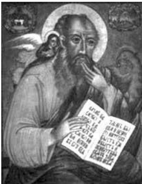
Святитель Андрей Кесарийский

Святитель Андрей Кесарийский , один из лучших толкователей Апокалипсиса, рассеивает наши сомнения: воплощаться ангелы не могут. Это может делать только Творец. Он нам это продемонстрировал 2 тысячи лет назад, когда стал человеком, оставаясь Богом. Дьявол, как и прочие бесы, может лишь в кого-то вселяться. Вспомним евангельскую историю про бесноватого человека из страны Гадаринской. В нём жили бесы. Потом они переселились по приказу Спасителя в стадо свиней, которые сиганули в море с обрыва. Святитель говорит, что никакого воплощения дьявола не было; сатана просто «прописался» и стать жить в антихристе, пребывая в нём как в своём избранном сосуде. Следовательно, антихрист – одержимый, бесноватый человек.