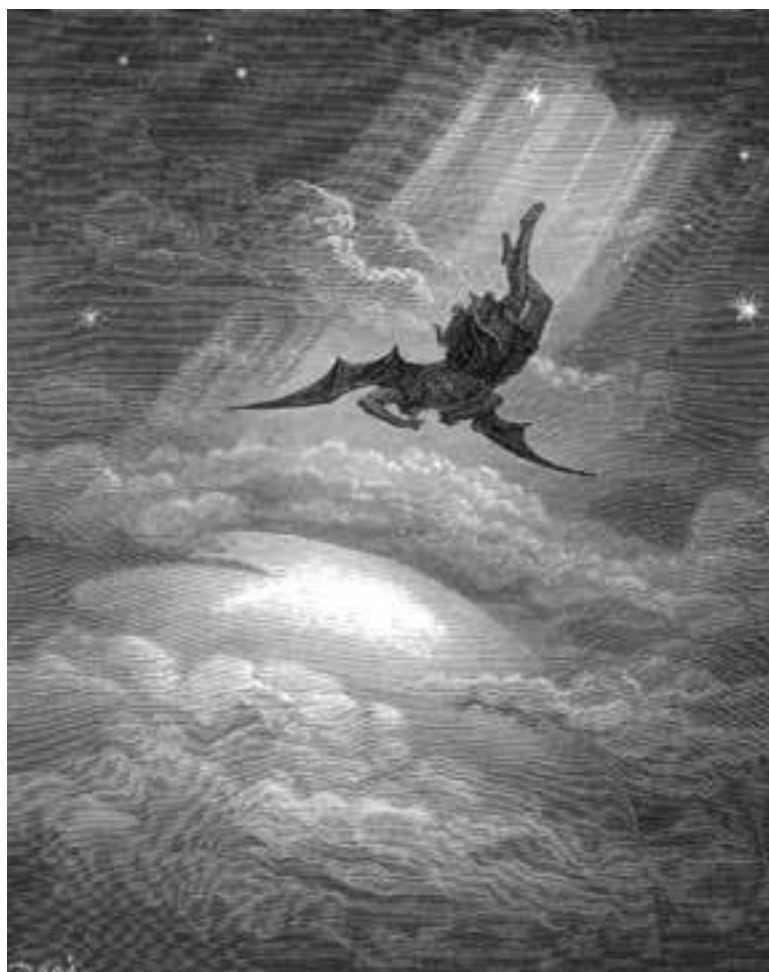
Гюстав Доре. «Падший Люцифер», 1866 г.

Самый главный из «троицы» персонаж – дьявол . Это персонаж не только последней книги Священного Писания, он постоянно фигурирует и в других книгах. Причём в Новом Завете даже чаще, чем в Ветхом Завете. И это понятно: Бог воплотился в человека в виде Иисуса Христа, пришёл на Землю. Возникла угроза безраздельному господству этого персонажа в мире. Все силы бездны напряглись. Дьявол выходит на разведку, беседует с Иисусом Христом в пустыне и пытается его искушать (Мф. 4:1-11; Лк. 4:1-13). Если в раю искушения первых людей дьяволом через посредство змия окончились для него успехом, то тут он потерпел полное фиаско.