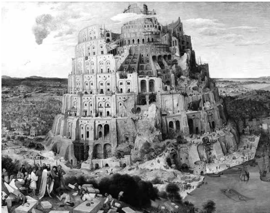
Вавилонская башня. Питер Брейгель Старший, 1563 г.