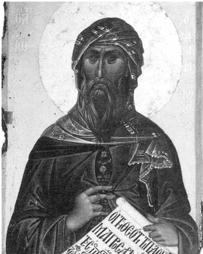
св. Иоанн Дамаскин