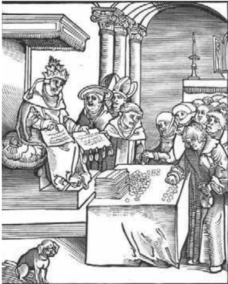
«Антихрист» Лукас Кранах-Старший