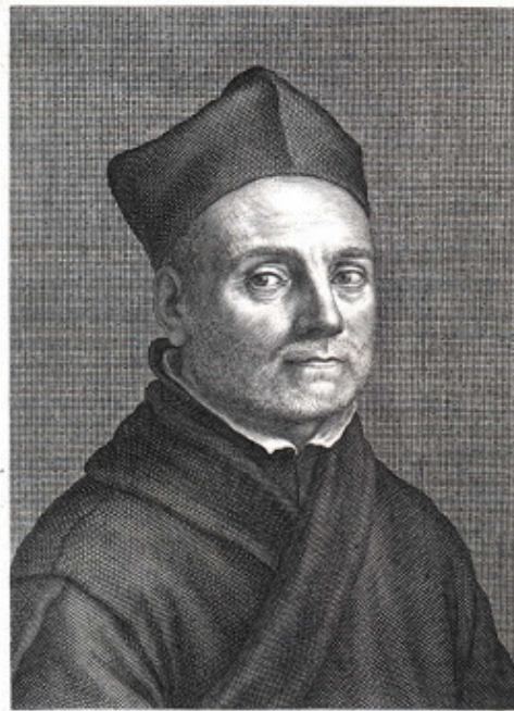
P. ATHANASIVS KIRCHERVS FVLDENIS è Societ: Iesu Anno ætatis LIII.