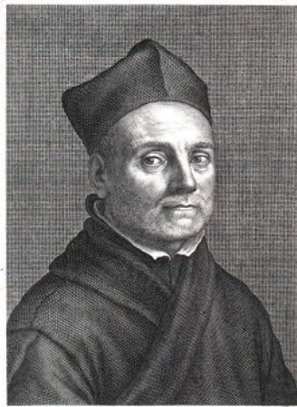
P. ATHANASIVS KIRCHERVS FVLVDENSIS e Societ: Iesu Anno ætatis LIII.

«Omnia in omnibus», что означает «всё во всём». Он не без основания полагал, что если все заключено во всем, то должна существовать и Единая наука, объединяющая все знания.