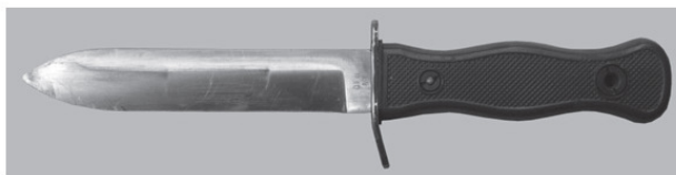
Фото 1. Боевой нож бундесвера, ФРГ – Германия, 1969 г.

Боевые ножи иностранного производства, несмотря на то что приняты на вооружение в соответствии с иным законодательством, по иным нормам и правилами, всегда остаются ножами боевыми. И их принадлежность к таким ножам может определить только специальная экспертиза (фото 1—2).