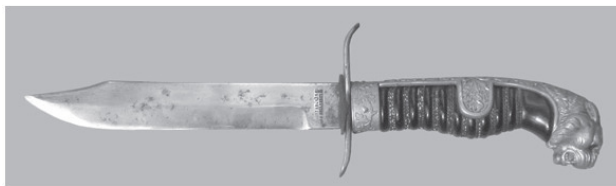
Фото 4. Боевой нож разведчика времен Великой Отечественной войны с рукояткой от трофейной немецкой сабли. Привезен на память с войны ветераном из Вены (Австрия)

Общий вывод из всего этого: нож, даже боевой, не более чем расходный материал. Инструмент войны. Простой, хотя и особого рода.