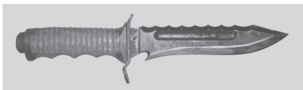
Фото 2. Современный российский боевой нож «Катран»