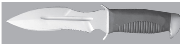
Фото 1. Современный российский боевой нож «Взмах»

Любой нож может быть боевым. При условии, если с его помощью можно выполнить боевую задачу. И такой задачей не всегда и не только является применение ножа в рукопашной схватке (фото 1—3).