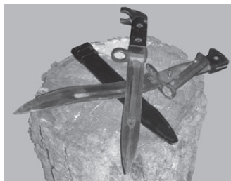
Фото 1. Два штык-ножа с одним названием – штык-нож к АК-47. Один советский, другой китайский. Как говорится, угадай с первого раза

В доказательство можно привести более чем красноречивый пример. Совсем недавно на отечественном лотошном рынке дешевых сувениров в большом количестве появились низкокачественные, изготовленные в Китае копии образцов боевых ножей мира. На первый взгляд, вроде все на месте. Но по факту это не более чем сувенир (фото 1).