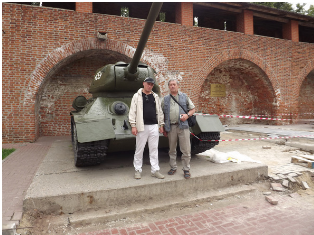
г. Нижний Новгород. Крепость. 2012 год.