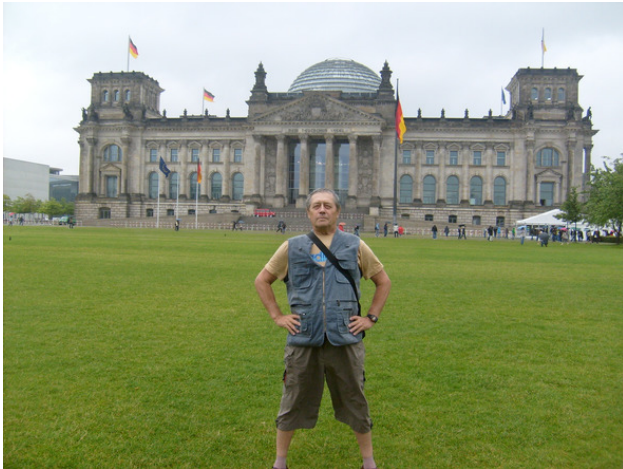
Германия. г. Берлин. Рейхстаг. 2011 год.

Автобус катился по Германии, удивляя нас, россиян, аккуратности и порядком на дорогах и вдоль дорог. Нам бы так наводить в своей стране порядок и дисциплинированность. Не далеко от границы с Францией автобус остановился у отеля на ночлег. Уже наступал вечер, мы устали от дороги. Поужинали и разбрелись по номерам.