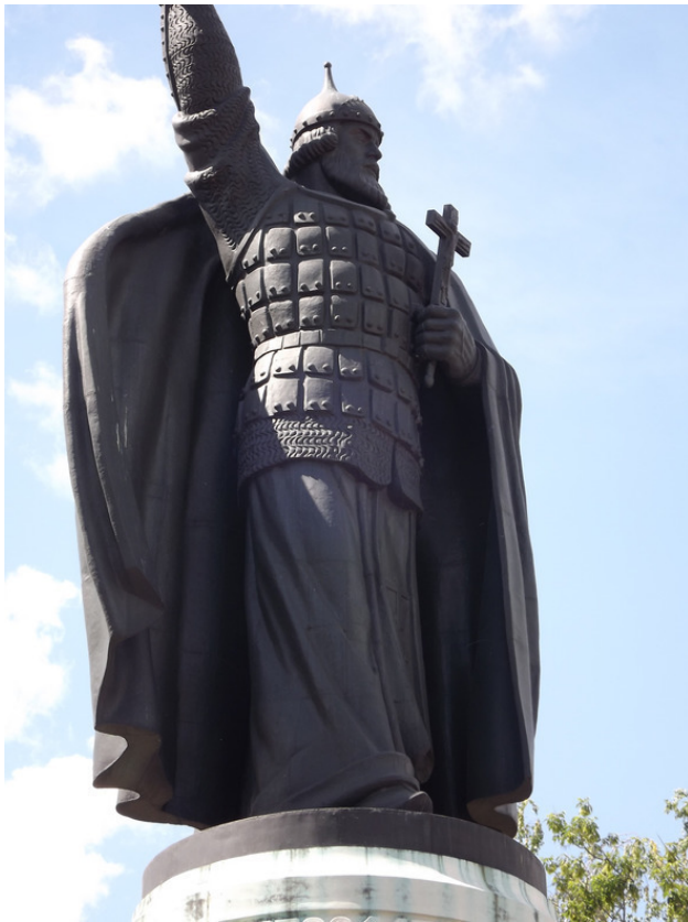
г. Муром. Памятник Илье Муромцу. 2012 год.

Рядом с женским монастырем поставлена скульптура в честь святых Петра и Февронии. Памятник высотой около четырёх метров. Прекрасный и великолепный, который вос-