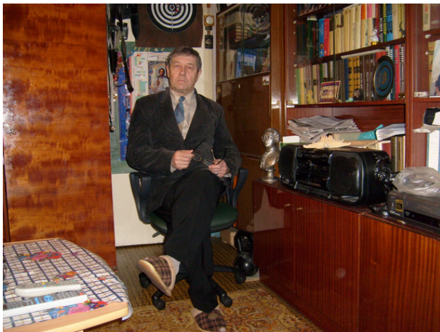
г. Асбест. Дома. 2009 год.