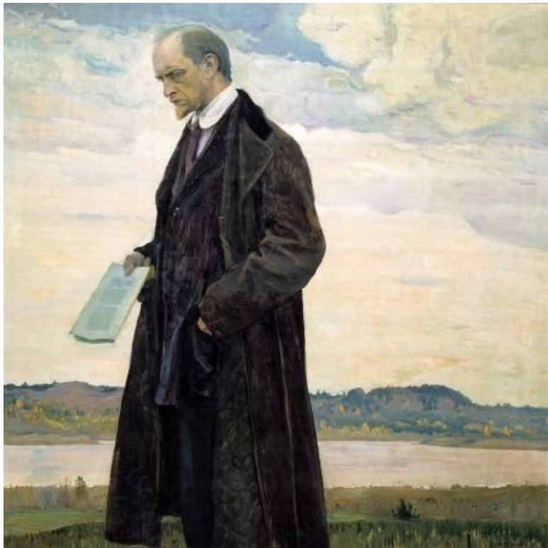
М.В. Нестеров. Мыслитель. Портрет Ивана Александровича Ильина 1921

Лишь напомню читателям, что 85 лет назад русский философ Иван Ильин выдвинул в своей работе «Спасение в качестве» творческую идею будущего нашей страны. Сосредото-