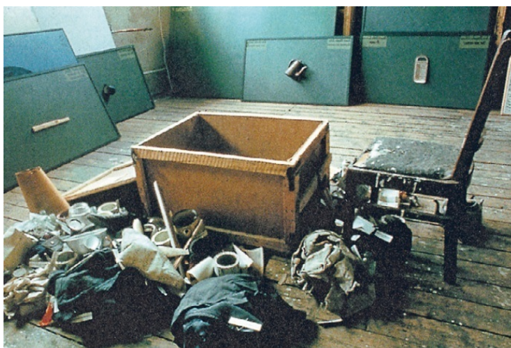
8–9. Коробка с мусором в московской мастерской Ильи Кабакова