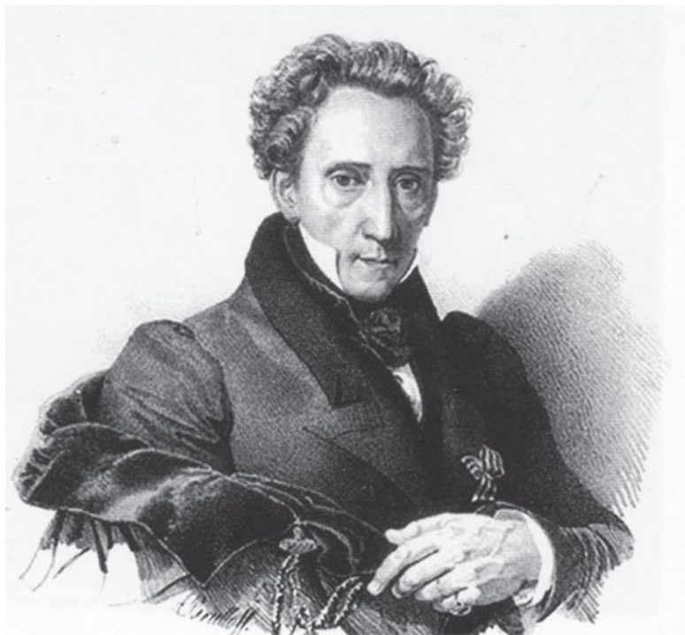
Граф Сергей Уваров

география, иностранные языки (и прежде всего, русский), отечественная история, литература и т. д.