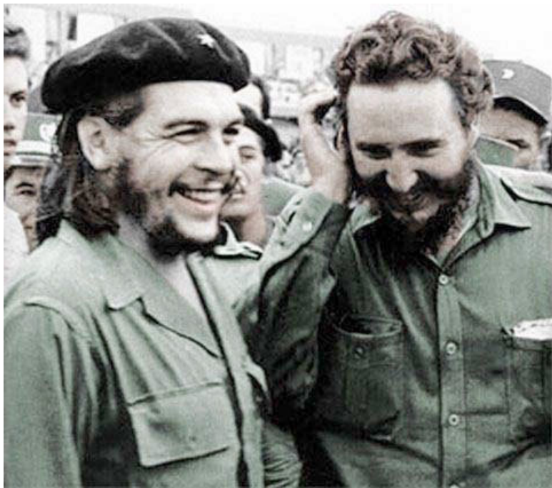
Че Гевара и Кастро

– Глупо получилось, амиго. Надеюсь, что вас не сильно придавили, но пожалуйста, не включайте больше вашу странную камеру здесь, в помещении.