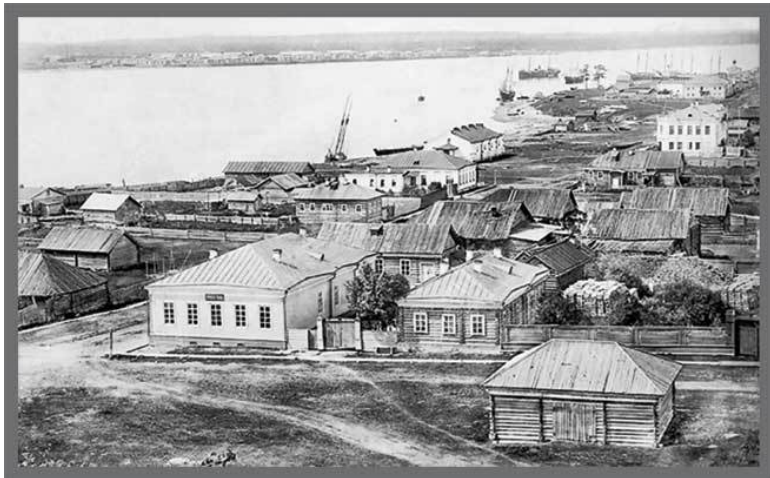
Город Онега. Фото нач. XX в. (Из фондов АКМ)