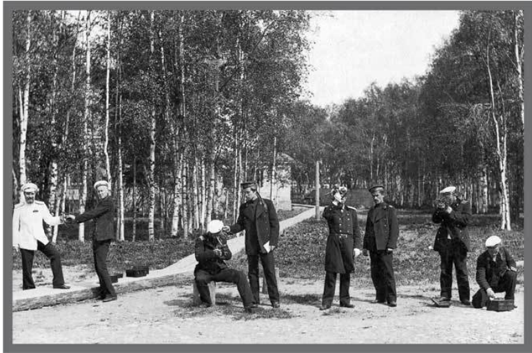
Занятия по астрономии в Архангельском торгово-мореходном училище. Фото нач. XX в. (Из фондов МАМИ)