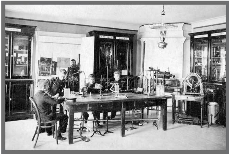
Кабинет физики в Архангельском торгово-мореходном училище. Фото нач. XX в.