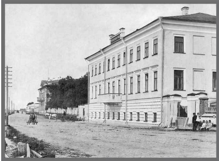
Здание Архангельского торгово-мореходного училища. Фото нач. XX в. (Из фондов АКМ)