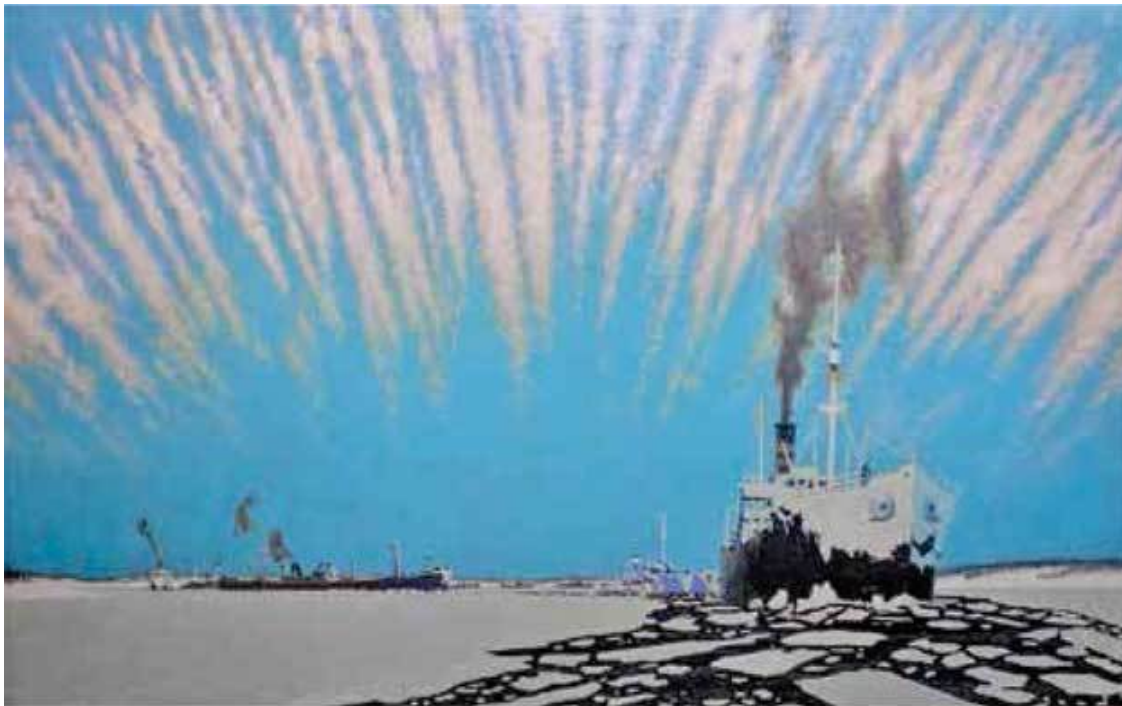
Картина английского художника Ч. Пирса «Приход одного из конвоев в Мурманск». Из собрания Национального морского музея Великобритании