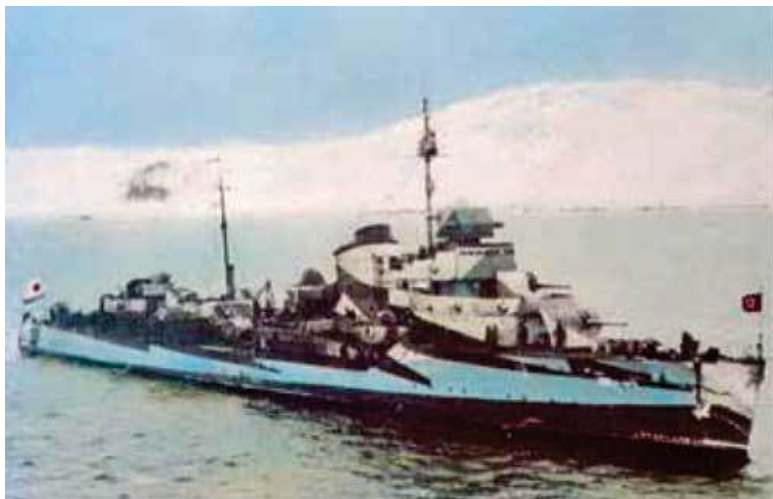
Эсминец Северного флота в походе

Советскому Союзу был предоставлен кредит в 10 млн. фунтов стерлингов из расчета выплаты 3 % годовых сроком на 5 лет. 29 сентября – 1 октября 1941 г. в Москве состоялась конференция представителей СССР, США и Великобритании, на которой было достигнуто соглашение о поставках Советскому Союзу техники, боеприпасов, стратегического сырья и военных материалов. В обмен на грузы военного назначения СССР обязался поставлять в Великобританию хромовую и марганцевую руду, золото, платину, пушнину, лес.