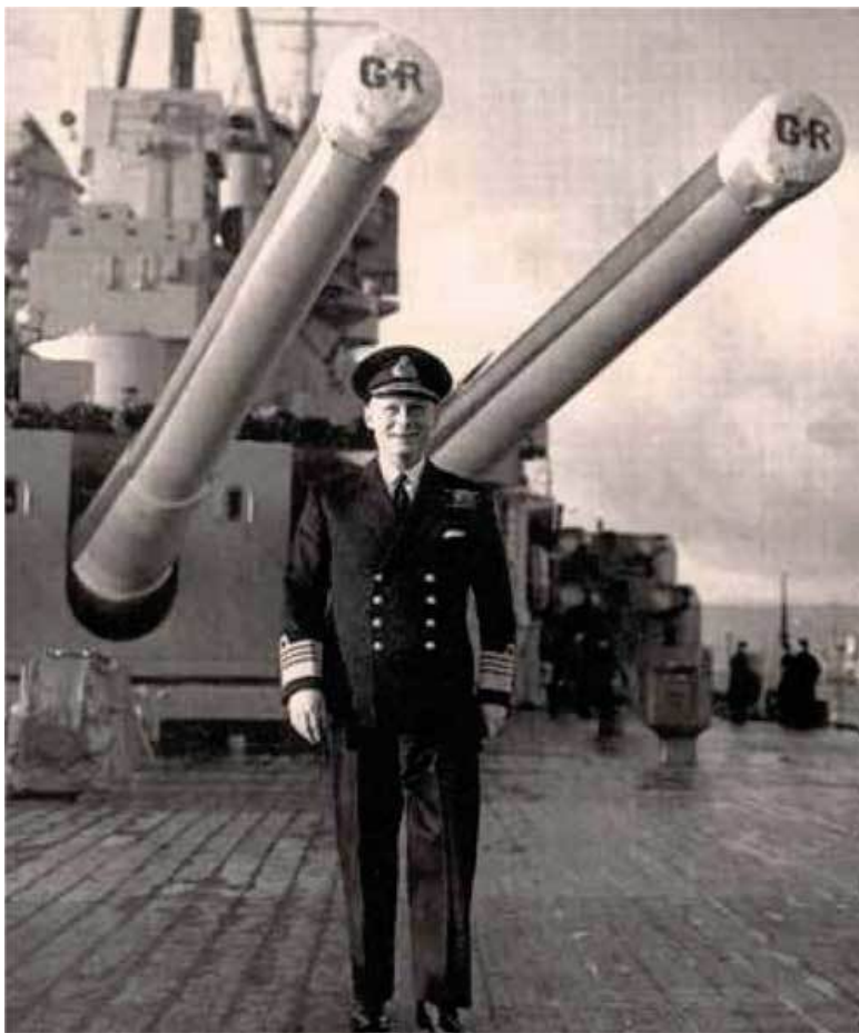
Адмирал Д. Тови, командовавший в 1940–1943 гг. флотом Метрополии