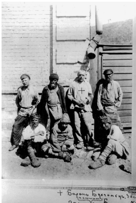
Группа нижегородских босяков. Подготовка материала для постановки МХТ спектакля по пьесе Горького А.М. "На дне": Барон Бухгольц, босяк (стоит, третий слева). Автор оригинала: Дмитриев М.П. 1902. НВ-1273

Другое дело, что у ивановских девчат впечатление от про-