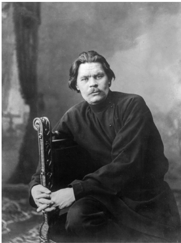
А.М. Горький. 1901 г. до 7 марта. КП-13411/Ф-716

А. И. Овчаренко в своей содержательной, богатой фактическим материалом книге «М. Горький и литературные искания XX столетия» убедительно показал Горького как писателя, открывшего «новую страницу в мировом искусстве».