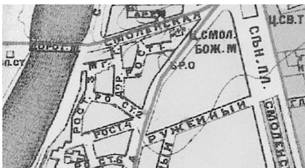
Карта Москвы Суворина 1907—1908 гг.