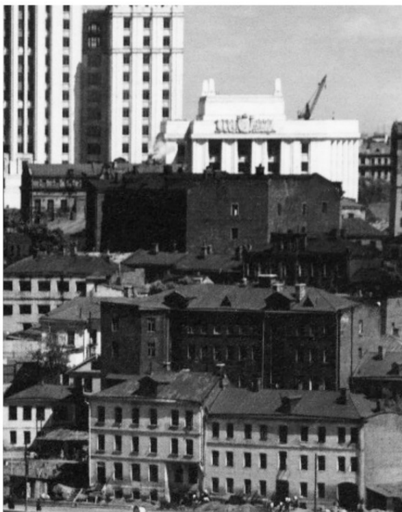
На фото хорошо видно весь комплекс вершины Мухиной горы: на переднем плане два дома на набережной, на втором плане Сушкин дом (темный), слева от него, чуть ниже, двухэтажн. дом семьи художников. Дом левее и чуть выше, с большими окнами, дом постройки середины XIX века, а за ним дома в начале Плющихи.

Название этой местности со временем менялось, и в совсем седой древности оно называлось и Мухой, и Мухиной горой, а то и просто Бережками. Известно еще, что в конце XIX века часть набережной со стороны Бородинского моста именовали Мухина улица и Мухина Гора, как название высокого берега Москвы-реки. На карте 1858 года мы видим, что современная Ростовская набережная, идущая от Дорогомиловского моста по берегу реки Москвы, носила название Улица Мухина гора. Есть еще одна интересная деталь на карте 1917 года: имя Мухина гора вписана в прямоугольник, расположенный рядом с Бородинским мостом, в месте, где на карте 1859 г. оно обозначено как Торговые бани. Очередная историческая загадка. Но как бы не менялись названия этой местности, ее границы всегда были неизменны: свое начало Мухина гора берет от Бородинского моста и условно заканчивается Виноградовскими банями.