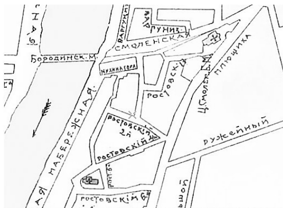
Карта Москвы из книги издания Сабашниковых 1917 года