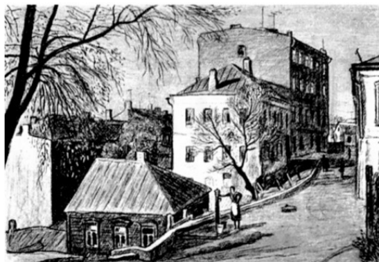
В.Вакидин. "3-й Ростовский пер. Пейзаж с колонкой". 1959 г.

"Иногда стоит потратить время на свое прошлое, занявшись воспоминаниями, дабы этим лучше осознать свое настоящее и, возможно, даже представить свое будущее. Если вам нужны причины, то ищите их в прошлом. Если нужны причины подлинные, то в далеком прошлом".