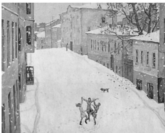
Игорь Попов. "Первый снег". 7-й Ростовский переулок. 1969 г.

"Напомните детству о себе и оно о вас вспомнит. Иногда просто закрывайте глаза и беседуйте с ним, со своим детством. Вы спрашивали меня: "Как избежать злости?" Просто позволяйте себе заглядывать к себе маленькому в гости. Ненадолго, вот и всё".