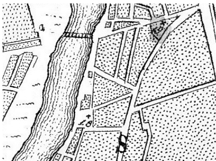
Мичуринский план Москвы 1739 г.