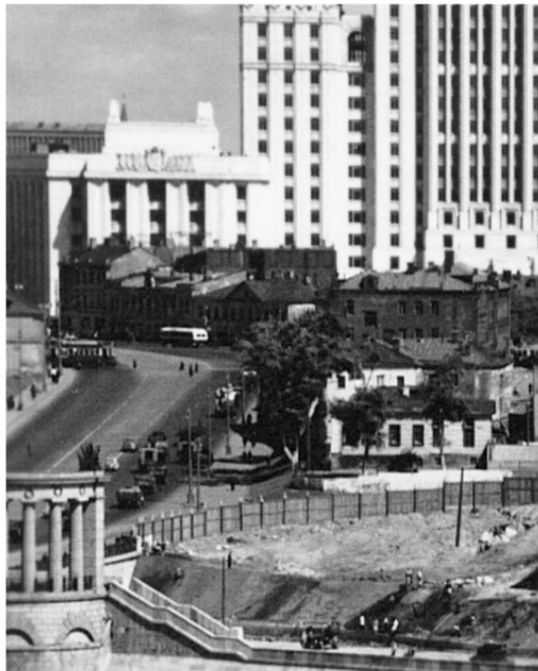
Начало Мухиной горы от Смоленской улицы и Бородинского моста. Огорожен, снесенный район "мыловарки". Строится съезд под мостом.

Мухина гора – реально существовавшее историческое название местности, сохранившееся на картах Москвы с XVIII века, имеет сегодня название Ростовская набережная, расположена в районе Хамовники по левому берегу Москвы-реки, между Смоленской улицей и Саввинской набережной, к западу от улицы Плющиха и соединенная с ней Ростовскими переулками.