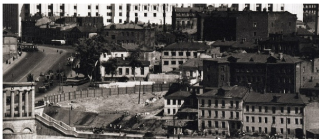
Начало Мухиной горы – от Бородинского моста. 1950 г.

На нижнем фото представлена южная часть Мухиной горы, конец 7-го Ростовского переулка, заканчивающийся Виноградовскими банями. Многоэтажный дом справа относится к Саввинской набережной.