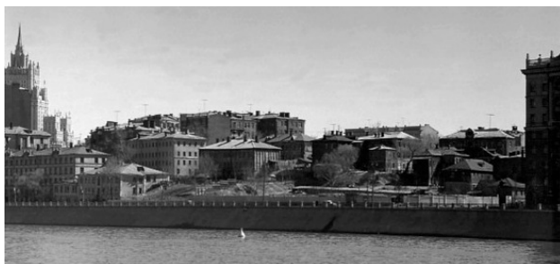
Конец Мухиной горы – Ростовской набережной и начало Саввинской. 1960 г.

После вдумчивого и внимательного изучения карт Москвы свободного доступа, обнаружено, что последнее свидетельство-изображение Ростовских переулков есть на карте 1952 года. Далее, почти на 40 лет карт с изображением переулков нет. Вероятно по причине наступившего