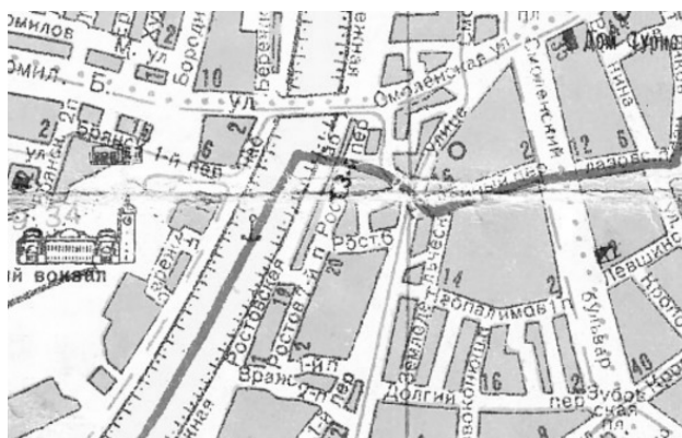
Карта Москвы 1938 года