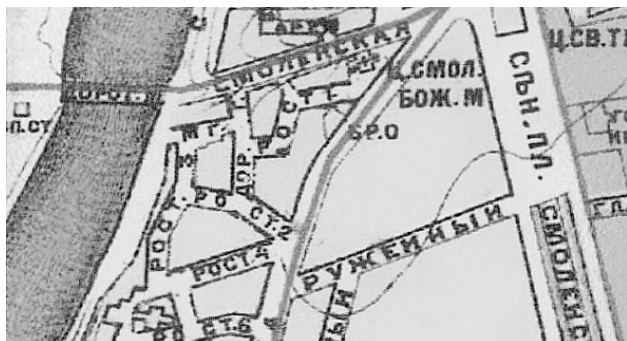
Карта Москвы Суворина 1907—1908 гг.