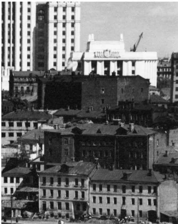
На фото хорошо видно весь комплекс вершины Мухиной горы: на переднем плане два дома на набережной, на втором плане Сушкин дом (темный), слева от него, чуть ниже, двухэтажн. дом семьи художников. Дом левее и чуть выше, с большими окнами, дом постройки середины XIX века, а за ним дома в начале Плющихи.

Название этой местности со временем менялось, и в совсем седой древности оно называлось и Мухой, и Мухиной горой, а то и просто Бережками. Известно еще, что в конце