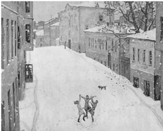
Игорь Попов. "Первый снег". 7-й Ростовский переулок. 1969 г.

"Напомните детству о себе и оно о вас вспомнит. Иногда просто закрывайте глаза и беседуйте с ним, со своим детством. Вы спрашивали меня: "Как избежать злости?" Просто позволяйте себе заглядывать к себе маленькому в гости. Ненадолго, вот и всё".