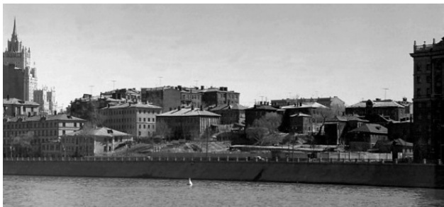
Конец Мухиной горы – Ростовской набережной и начало Саввинской. 1960 г.

После вдумчивого и внимательного изучения карт Москвы свободного доступа, обнаружено, что последнее свидетельство-изображение Ростовских переулков есть на карте 1952 года. Далее, почти на 40 лет карт с изображением переулков нет. Вероятно по причине наступившего противостояния востока и запада, холодной войны. Выпуск карт огра-