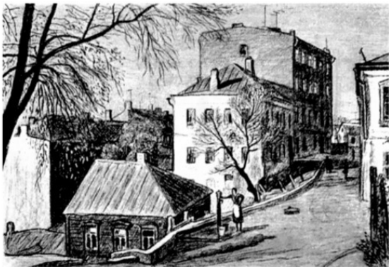
В.Вакидин. "3-й Ростовский пер. Пейзаж с колонкой". 1959 г.

"Иногда стоит потратить время на свое прошлое, занявшись воспоминаниями, дабы этим лучше осознать свое настоящее и, возможно, даже представить свое будущее. Если вам нужны причины, то ищите их в прошлом. Если нужны причины подлинные, то в далеком прошлом".