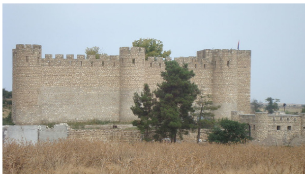
Фото 2. Крепость Шахбулаг.

Множество внешнеполитических факторов заставили Панах-хана заняться обороной своего государства. С этой целью он решил основать новый город-крепость. Так он высказался об этом на заседании Дивана в Шахбулаге: