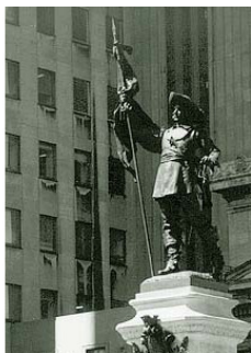
Фото 1. Статуя на площади Плацдарм в Монреале

В 1652 году ему пришлось снова уехать во Францию, где он нашёл сто добровольцев для защиты Монреаля. Когда с этой сотней он вернулся в Монреаль, там оставалось только 50 поселенцев – остальные вынуждены были бежать в Квебек. Скоро колония усилилась настолько, чтобы противостоять нападениям. В 1665 году Мезоннёв был отозван во Францию. Он умер в Париже всеми забытый в 1676 году.