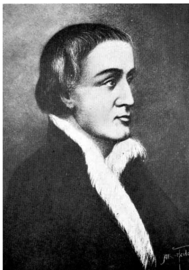
Рис.2. Поль Шомеди, съёр де Мезоннёв

Родился в аристократической семье в провинции Шампань (Франция). Начал военную карьеру в возрасте 13 лет.