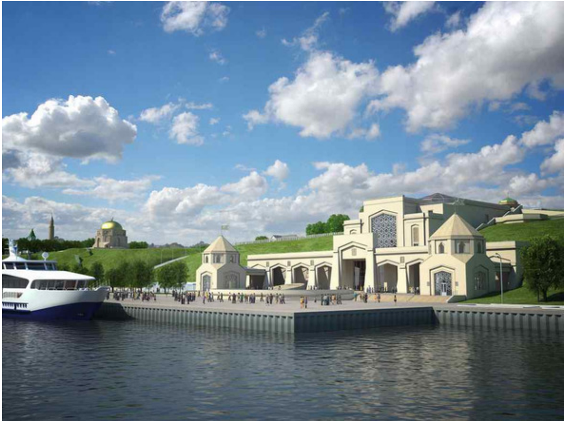
Фото. 5. Болгар. Пристань на реке Волга