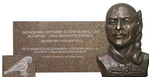
Фото.4. Памятная доска Хану Аспаруху. Открыта в декабре 2010 г. в Болгарии на Дунае

Кубрат считается одной из наиболее значимых личностей в болгарской истории и истории России. Это человек, который объединил разрозненные племена. Дал толчок будущей болгарской государственности на Дунае и Волге.