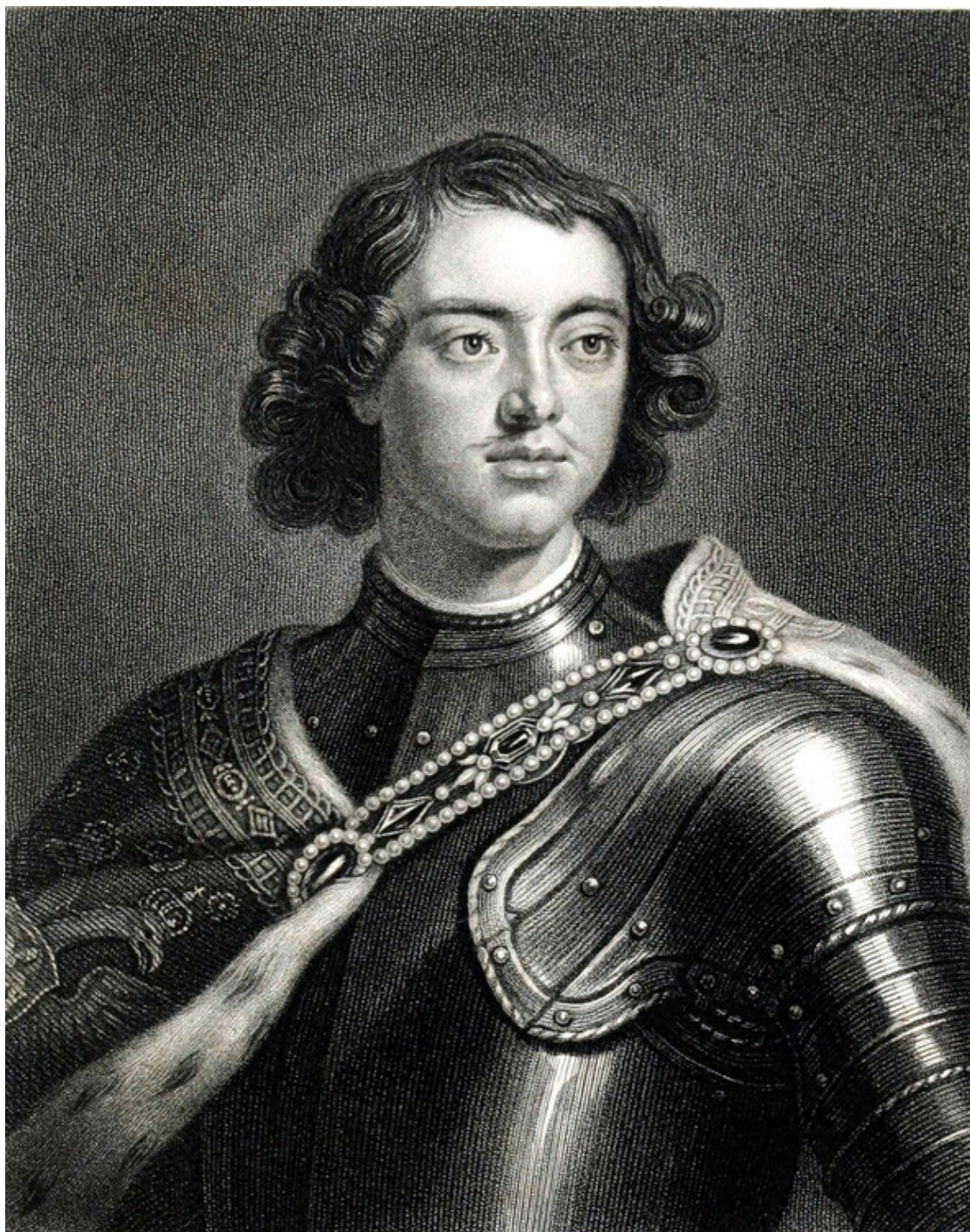
Рис.1. Петр I, основатель Санкт-Петербурга

О больших и известных городах написано колоссальное количество литературы, подлинных историй и легенд, исторических справок и воспоминаний, опубликована масса фотографий и снято множество фильмов.