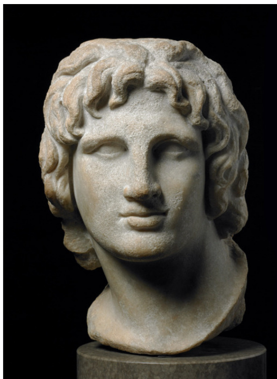
Фото 3. Александр Македонский – величайший завоеватель Древнего мира.

Александрия была основана Александром Великим в 331—332 году до Р. Х. после завоевания им Египта и названа в его честь. История ее появления изложена в многочисленных и часто противоречивых свидетельствах из разных античных источников. По одной из легенд Александр начертил план нового города, насыпав основные линии зерном, поскольку у него под рукой не оказалось мела. Некоторые авторы упоминают стаи птиц, которые слетались к ногам великого полководца и склевывали зерно. Спутники Александра истолковали это как хороший знак: новый город будет процветать и кормить многие народы. По сведениям Псевдо-Каллисфена, на территории будущего города располагалось 16 египетских деревень, из которых значительным было лишь поселение Ракоте или Ракоти (коптско-саидский rakote , бохайрский гако+ – «основанное богом Ра»), где уже при фараонах Саисской династии (VII – VI вв. до Р. Х.) селились греки. Впоследствии это имя носил один из кварталов, а египтяне называли так сам город.