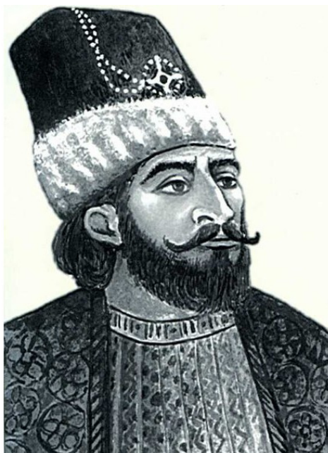
Рис.3. Панах-Али-хан, Карабахский хан 1747 – 1763 г.г.

баху были присоединён Зангезур и поставлены в зависимость ханы Гянджи, Нахичевани, Эривани и Ардебилля, а также ликвидировано самоуправление армянских меликов (правителей) Нагорного Карабаха.