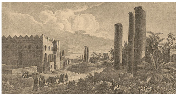
Рис.5. Ворота квартала «Дельта» в Александрии. L. G. Casas'a («Voyage pittoresque de la Syrie, de la Phenicie, de la Palestine et de la Basse Egypte», II).

План Александрии, разработанный архитектором Дейнократом по системе Гипподама, был основан на прямоугольной сети улиц; 2 осевые и очень широкие (более 30 м.) улицы с колоннадами по сторонам перекрещивались с многочисленными мелкими улицами. Древний город был окружен стенами. О размерах Александрии позволяют судить сведения Страбона, посетившего Египет в 25—24 году до Р. Х. вместе с префектом Египта Элием Галлом: 30 стадиев (5,3 км) в длину, от 7 до 8 стадиев (1,2—1,4 км) в ширину. Город делился на 5 районов (климатов), обозначавшихся первыми 5 буквами греческого алфавита: А, В, Г, Х, Е. При императоре Адриане (117—138) город увеличился еще на один район, названный в честь императора – Адрианов. Описание Александрии римского времени, сделанное после 117 и до 272 года, сохранилось в хронике Михаила Сирийца XII века. Сообщая, что в городе насчитывалось, без учета пригородов, 2478 храмов, 47 790 (по др. версии, 24 296) домов и 1561 терм, этот источник называет Александрию величайшим городом мира. Действительно, во времена империи она уступала по величине только Риму /drevo-info.ru/.