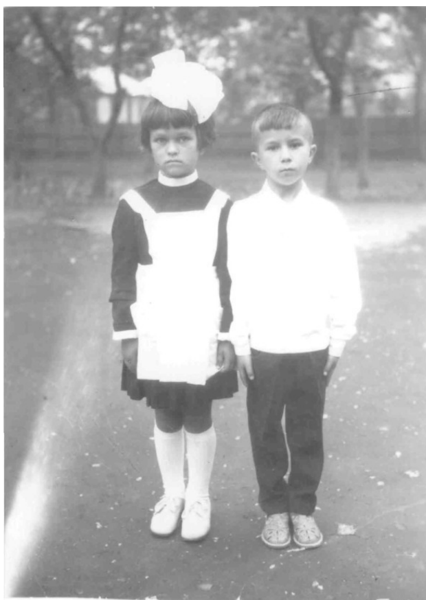
В первый раз в первый класс – 1 сентября 1972 года