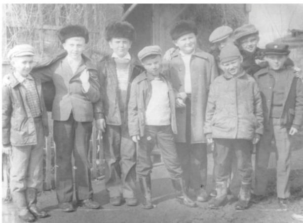
Школьные друзья (я – как всегда в центре внимания)