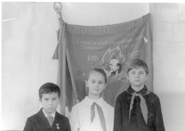
Пионеры – отличники. А награда – фото у Красного Знамени (я, как всегда, самый маленький)