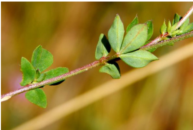
Размещение листьев на стебле