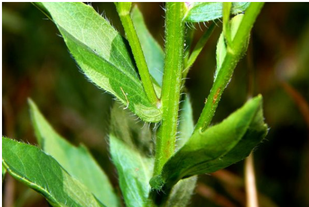
Стебель с листьями

Современный ареал однолетнего мелколепестника еще больше – вся средняя полоса Евразии, Азия.