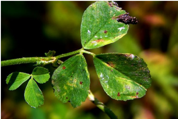
Листовая пластинка сверху