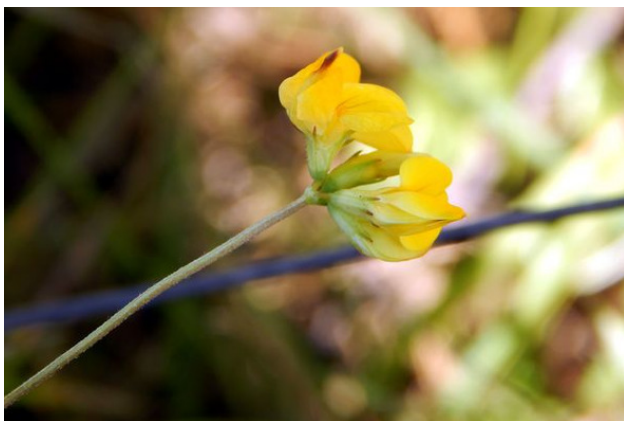
Соцветие лядвенца – пятицветковый зонтик