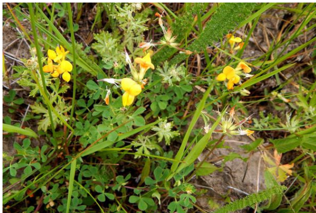
Кусти́к лядвенца рогатого

Цветки у травы мотылькового типа. Вырастают они на коротких цветоножках. Венчик у цветков желтый или с красноватым оттенком, небольшой (до 18 мм). В одном соцветии (зонтиковидном) находится 5—6 цветков.