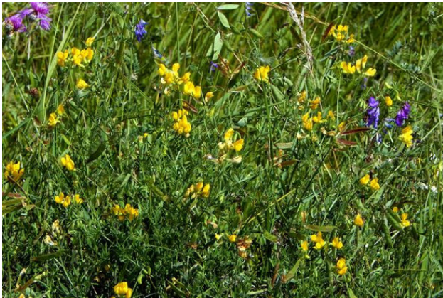
Разнотравье с преобладанием лядвенца рогатого