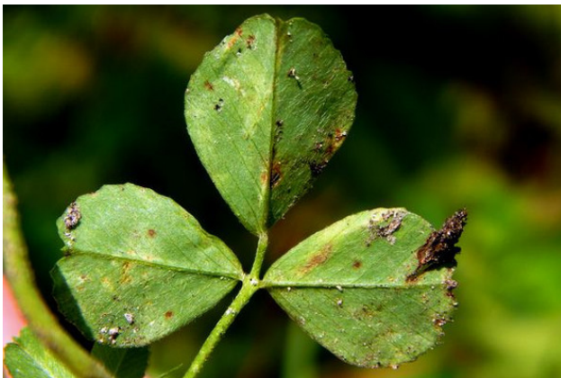
Листовая пластинка снизу