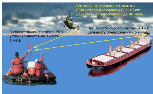
Рис. 1. Дальность обнаружения терпящих бедствие с помощью РЛО

На борту судна валовой вместимостью 500 рег. тонн и более должны быть, по крайней мере, три РЛО. На судах валовой вместимости от 300 до 500 рег. тонн должен быть, по крайней мере, один РЛО.