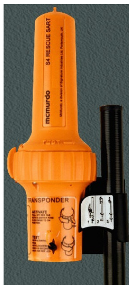
Внешний вид радиолокационного ответчика