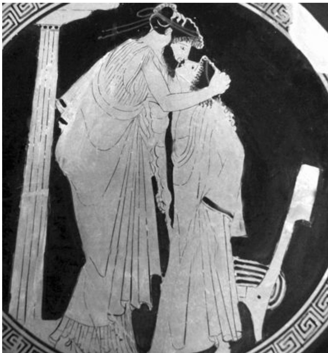
Поцелуй (предположительно Елена и Менелай). Деталь росписи краснофигурной вазы

Одиссей, предлагая Тиндарею предоставить дочери право выбора, видимо, надеялся, что Елена выберет его. Но она предпочла молодого красавца Менелая, могучего и светлокудрого. Он и его старший брат Агамемнон когда-то правили Микенами, но вынуждены были бежать оттуда и нашли приют в Спарте. Возможно, Одиссей же первый и был недоволен ее решением... Но клятва была произнесена и исполнена: все женихи смиренно приняли выбор Елены.