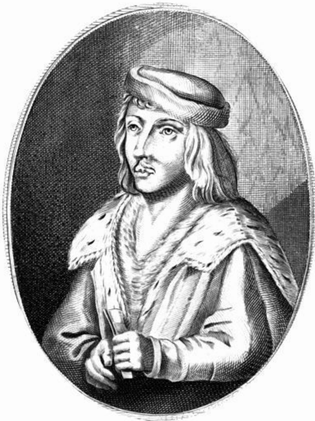
Иаков II Шотландский. Старинная гравюра

Переговоры шли долго. Когда четыре года назад Марию сосватали в первый раз, её отец заявил, что не может выплатить такое приданое, какое хотела бы сторона жениха, и брак не состоялся. На этот раз всё было серьезнее, и в феврале 1449 года к шотландскому двору отправились представители Бургундии, чтобы обсудить детали брачного контракта. Нам известно лишь, что отмечены эти переговоры были великолепным турниром в Штирлингском замке, где девятнадцатилетний Иаков II, несмотря на возраст, уже немало к тому повидавший в своей жизни, сражался против бургундского рыцаря. А сам брачный контракт был подписан 1 апреля. Помимо политического союза королевства Шотландия и двух герцогств, Бургундского и Гель-