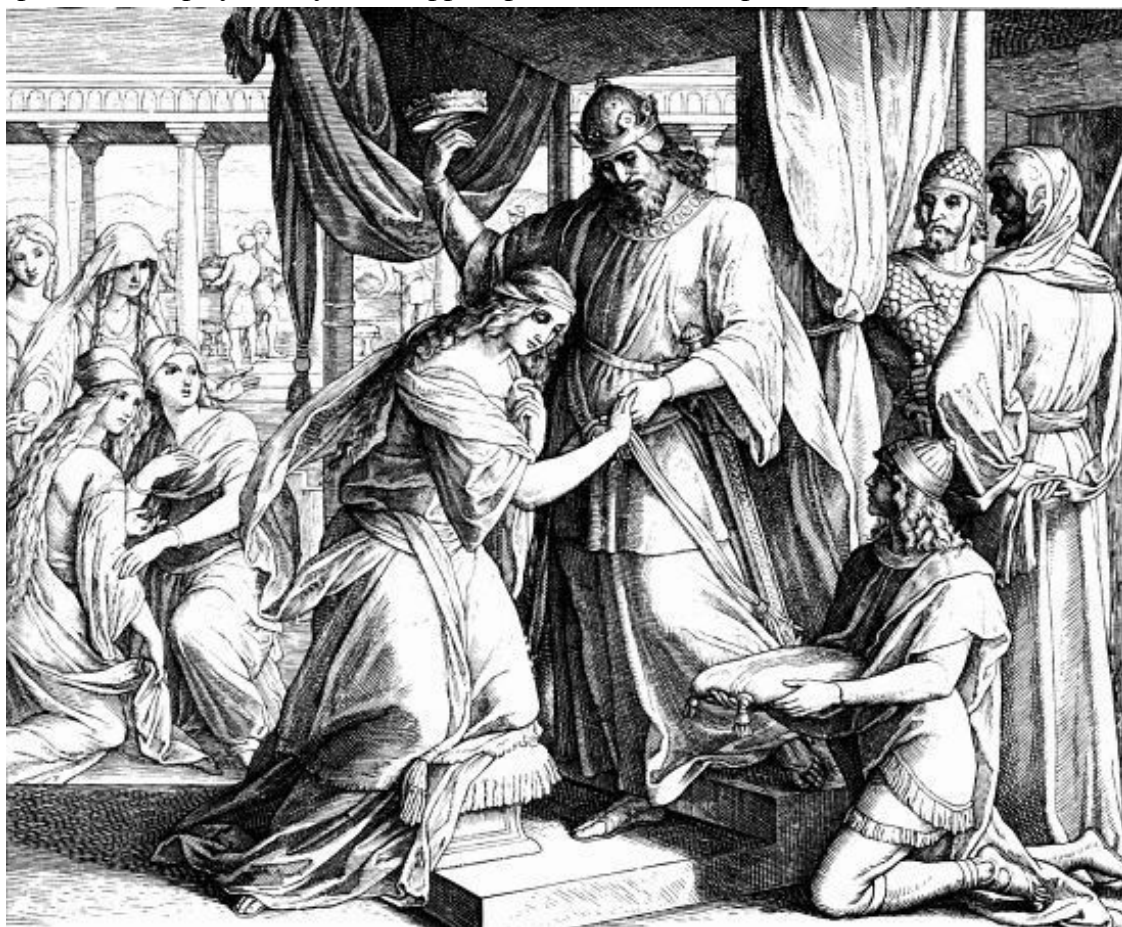
Свадьба Эсфири. Художник Ю. Шнорр фон Карольсфельд