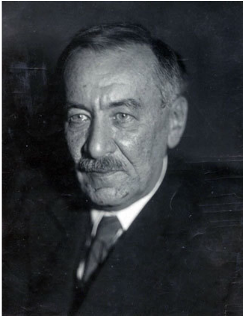
Леонид Мандельштам (1879-1944)