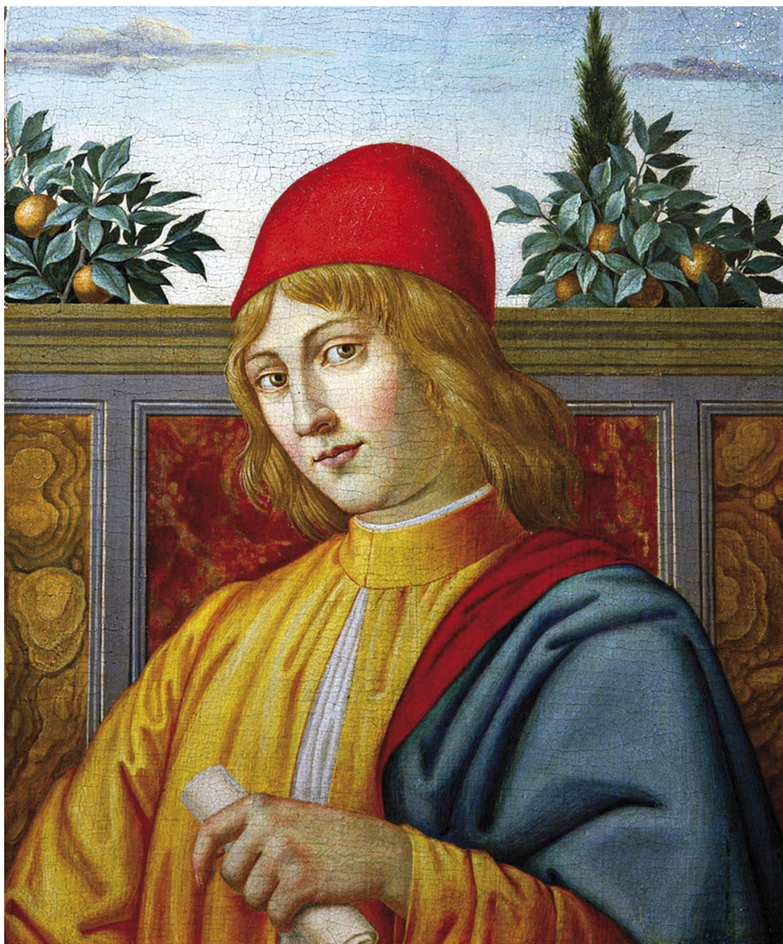
Леонардо да Винчи. Автопортрет