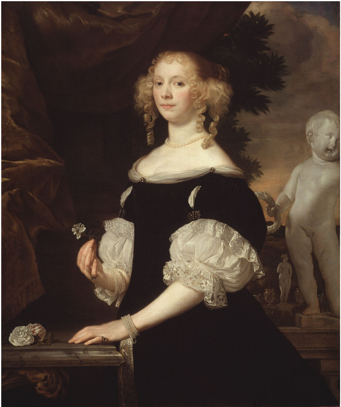
Портрет белокурой красавицы

Услышав такое обвинение, Рошфор выхватил шпагу и напал на д'Артаньяна. Д'Артаньян отбил все его удары и сам перешел в наступление. Тогда трактирщик крикнул слуг, и один из них ударом палки по голове оглушил юного дуэлянта.