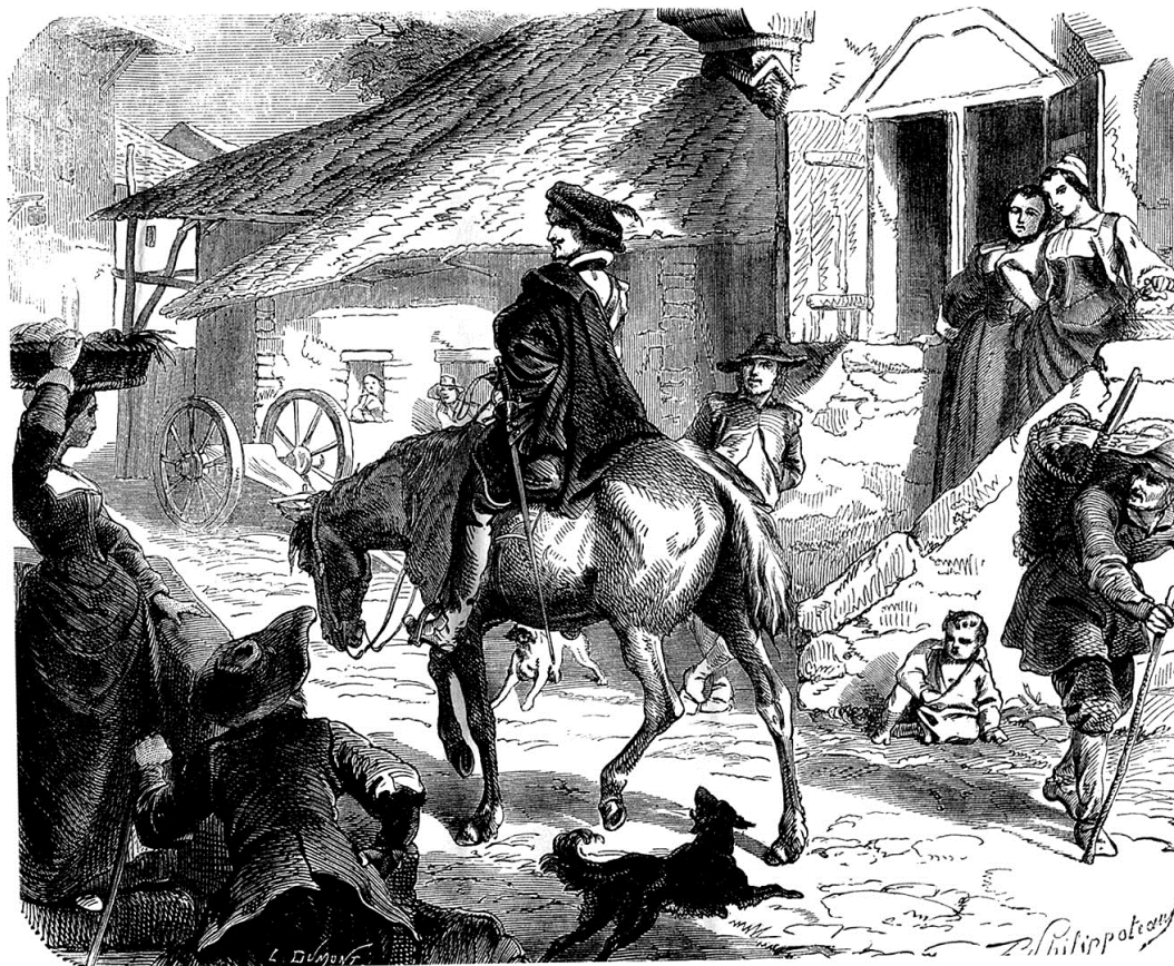
Д'Артаньян у трактира

В одном из городов, недалеко от Парижа, д'Артаньян увидел у трактира роскошную карету и белокурую красавицу вместе с сопровождавшим ее дворянином.