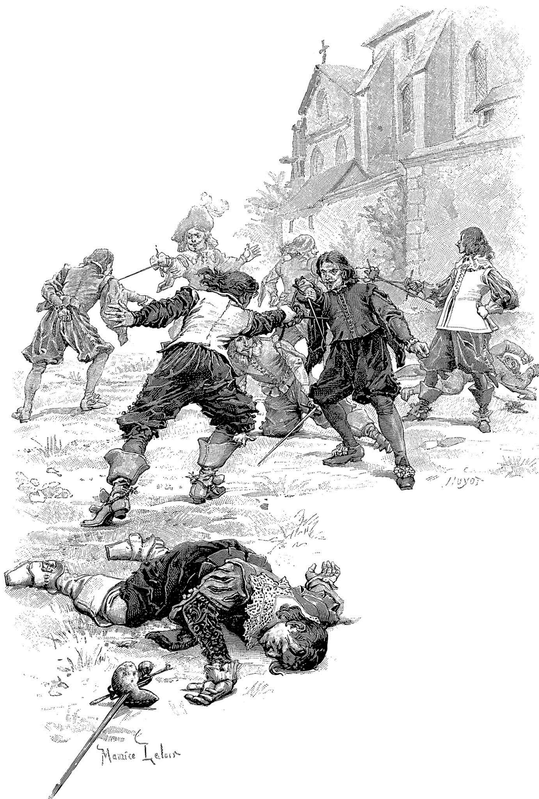
Поединок мушкетеров с гвардейцами

Портос сражался с одним из гвардейцев и успел ранить его. Арамис отвлекал сразу двоих.