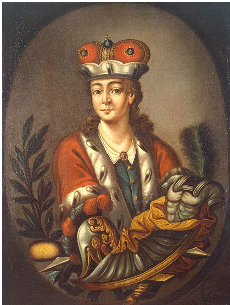
Ф. Г. Волков – создатель русского профессионального те-