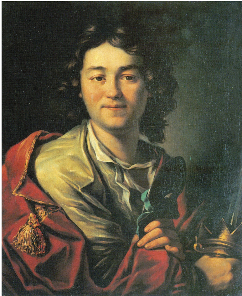
Ф. Г. Волков – основатель русского театра