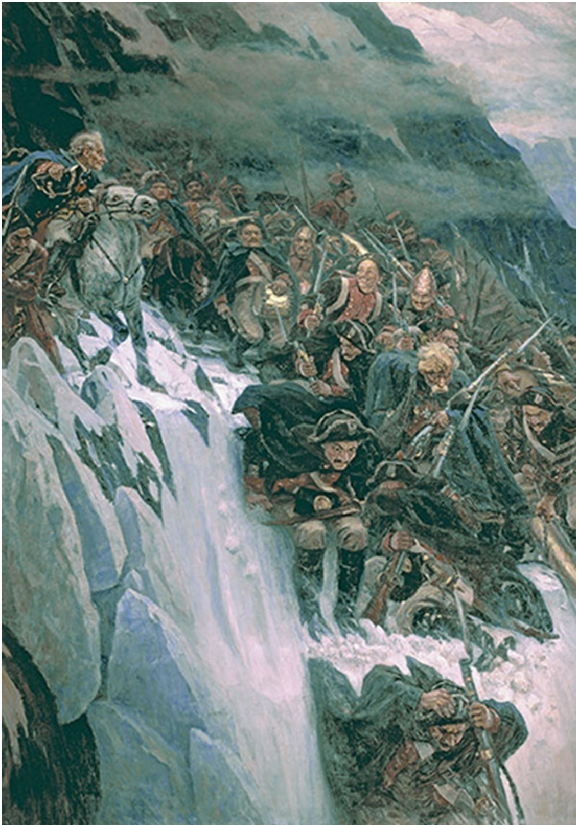
Переход Суворова через Альпы. Художник В. И. Суриков

Но потом, уже после смерти великого полководца, Павел I заключил с Наполеоном союз и хотел вместе с ним завоевать Индию, чтобы изгнать из нее англичан, которые захватили в Средиземном море остров Мальту, оскорбив тем самым Павла I – он ведь был Великим магистром Мальтийского рыцарского ордена.