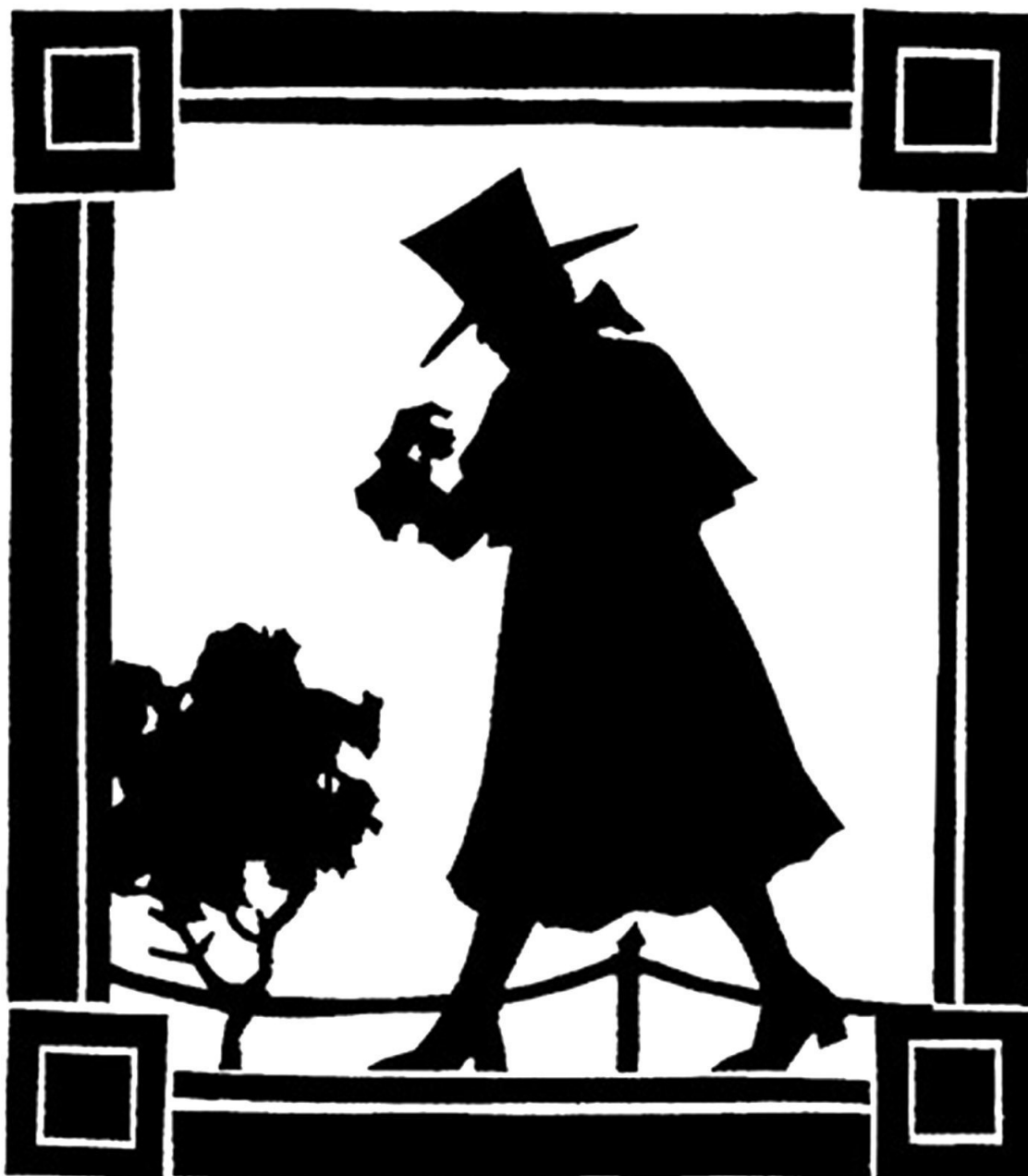
Евгений Онегин. Художник В. В. Гельмерсен

Онегин безупречно танцевал мазурку, умел элегантно кланяться, одевался как денди – так в Лондоне называли молодых франтов, щеголявших модной одеждой.