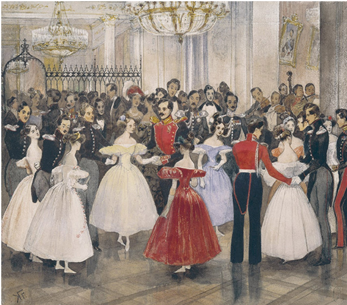
Бал у княгини М. Ф. Барятинской. Художник Г. Г. Гагарин

В одном из лирических отступлений, которых много в романе, Пушкин увлеченно описывает свои переживания, вызванные видом прекрасных женских ножек: