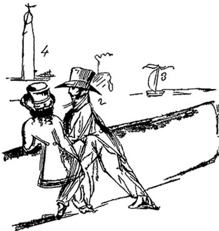
Пушкин и Евгений Онегин на берегу Невы. Рисунок А. С. Пушкин

Одни литературоведы считают, что поэт назвал своего героя по имени Онежского озера или реки Онеги. Другие пишут, что Пушкин взял имя и фамилию булочника из Торжка: оказавшись проездом в этом городке, он прочитал их на вывеске, и ему очень понравилось созвучие – Евгений Онегин.