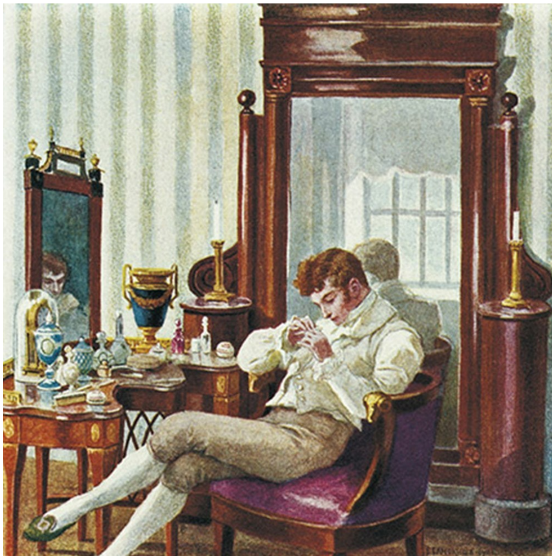
Утро Евгения Онегина. Художник Е. П. Самокиш-Судковская

После прогулки по Невскому проспекту Онегин, как только начинало темнеть, ехал в знаменитый французский ресторан. Там его уже ждали друзья – такие же, как и он сам, молодые люди из богатых семейств и гвардейские офицеры, веселые повесы и охотники до любовных приключений. На столе красовались кушанья, доставленные из Парижа, и бутылки шампанского. Один такой обед стоил столько же, сколько крестьянская семья в то время тратила на еду за несколько лет.