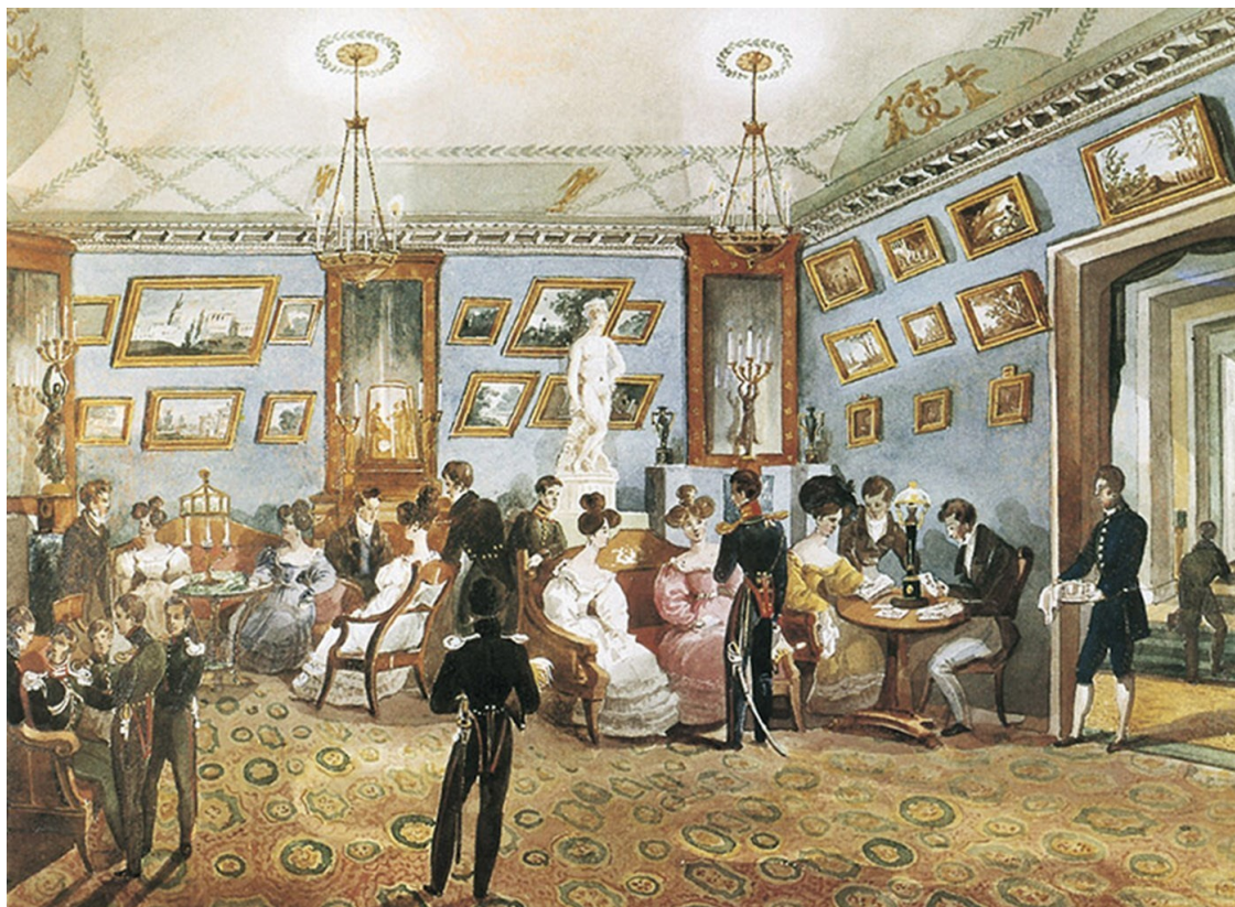
Великосветский салон. Неизвестный художник

Не изучая многотомные сочинения, он тем не менее помнил все интересные эпизоды из древней и современной истории, умел, с видом знатока, поддержать разговор на научные темы и оживить беседу эпитаграммой, вызывающей улыбку дам.