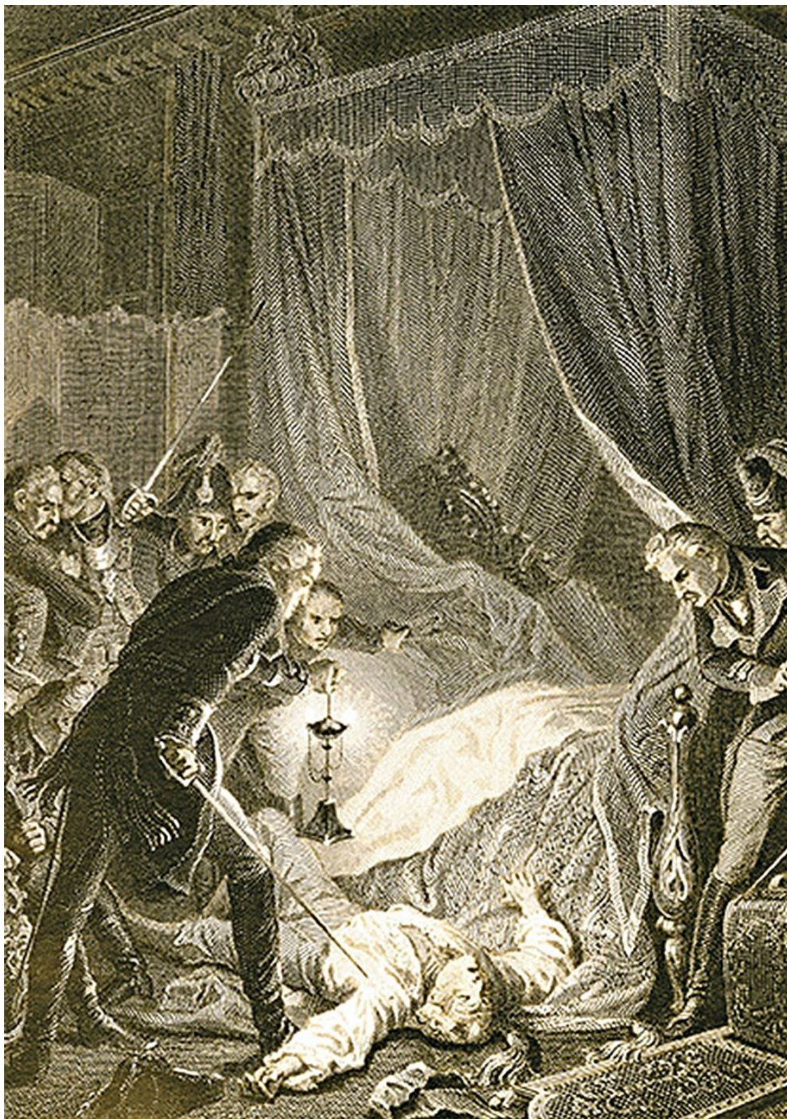
Смерть императора Павла I Петровича.

Гвардейские офицеры екатерининских времен, недовольные правлением Павла I, с помощью английского посла организовали государственный переворот. Павел I был убит, а на престол взошел его старший сын, любимый внук Екатерины II – Александр I.