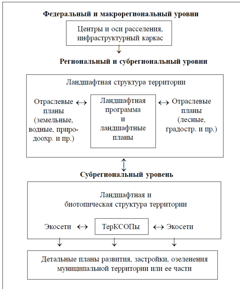
Рис. 1. Ландшафтное планирование в системе общего территориального планирования.