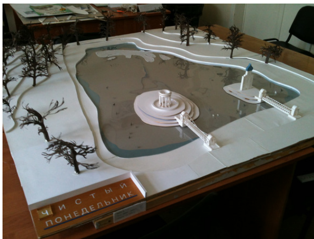
Фото 1. Общий вид проекта.

В большинстве случаев проект вызывает у тех, кто его видит, недоумение, чаще всего его называют «странным», и эта реакция объединяет как профессионалов, так и от людей далеких от искусства, архитектуры и градостроительства.