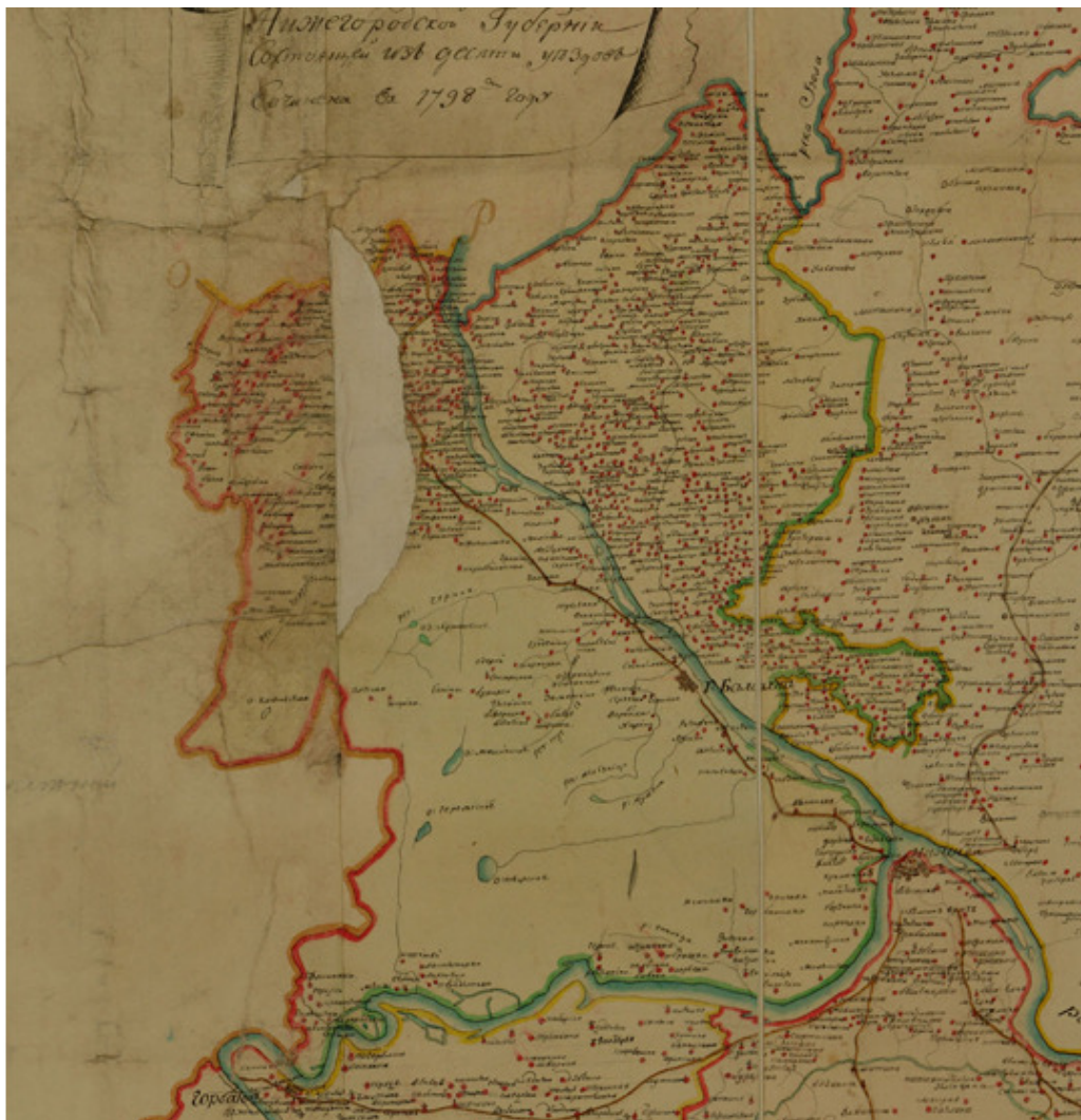
Карта Балахнинского уезда