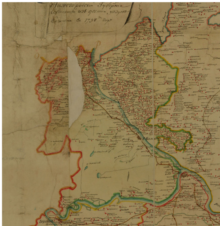
Карта Балахнинского уезда