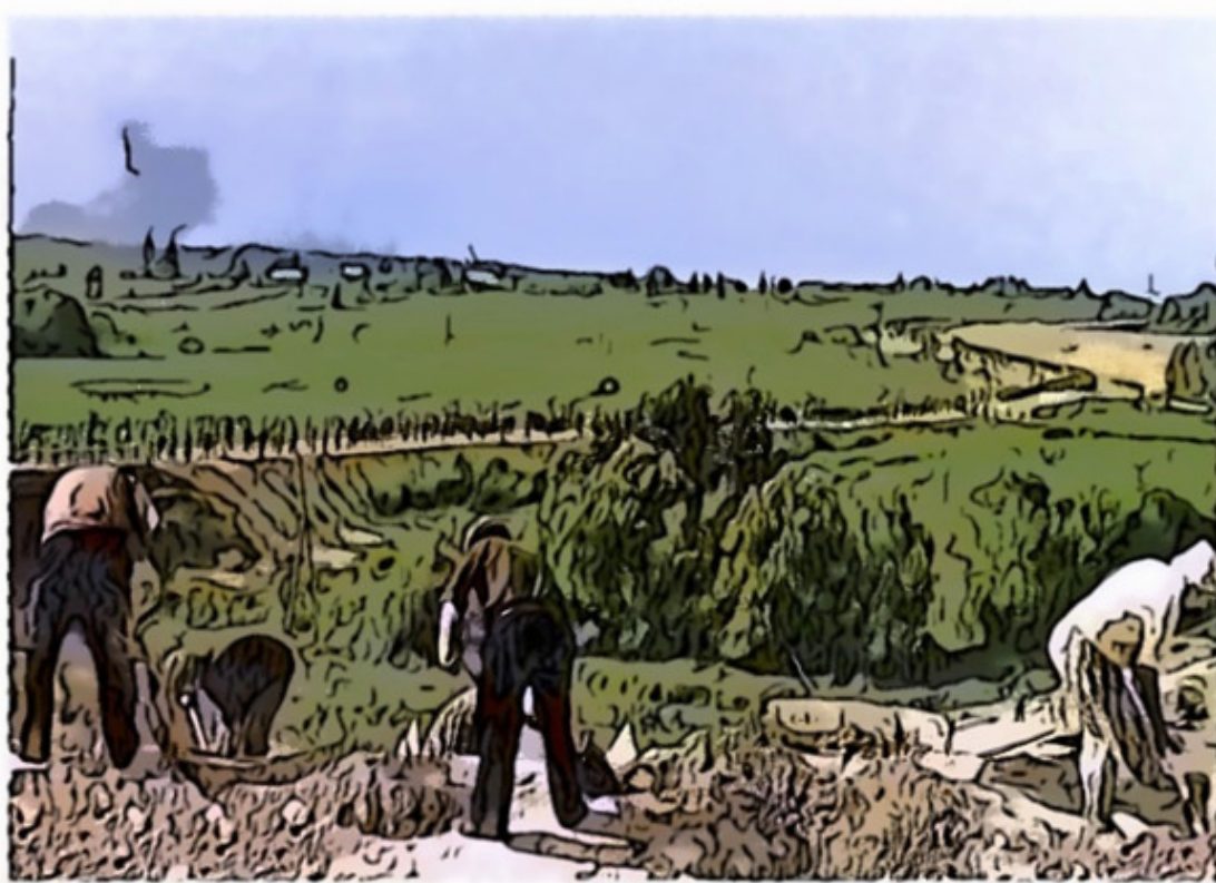
Строительство оборонительных рубежей

Немцы напали внезапно. Они сумели нанести серьезный урон Красной армии. Взяли в плен много солдат и разрушили большое число танков и самолетов. Фашисты хорошо подготовились к войне. Это позволило врагу идти вперед и теснить наших солдат.