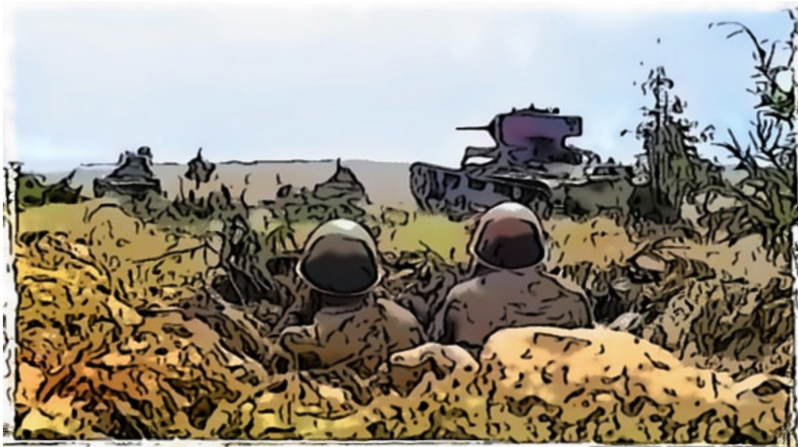
Бой с врагом

Немецкая армия старалась окружить Ленинград. Враг планировал отрезать город от остальной страны. Одна из немецких дивизий вышла к реке Неве. Тяжелые бои шли на станции Мга. Этот небольшой город переходил из рук в руки. Но сил и средств защищаться становилось все меньше. Здесь Красная армия отступила. Мы потеряли последнюю железную дорогу, которая связывала Ленинград с остальной страной. Снабжение города продовольствием и оружием стало невозможно.