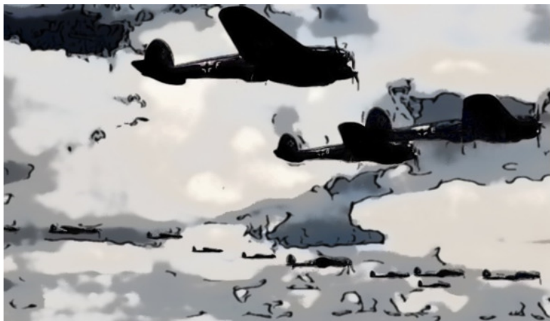
Вражеские самолёты в ночном небе

латые машины со свастикой. Те русские летчики, что сумели подняться в воздух, оказали решительное сопротивление фашистам. Успешно стреляли и наши зенитчики. За один только день они сбили более 60 самолетов противника.