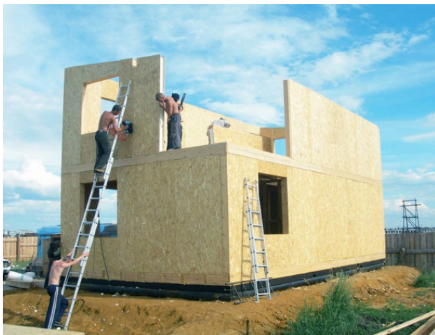
Каркасно-панельный дом из СИП-панелей

В целом, технология возведения панельного дома следует общим принципам постройки «каркасников» – применение облегченного фундамента, отсутствие дополнительного утепления, быстрота возведения, приемлемые цены строительства.