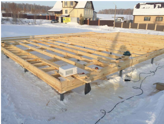
Фундамент на винтовых сваях

Устройство такого фундамента может быть осуществлено под ключ буквально за 1—2 дня, а цена его намного ниже, чем железобетонного.