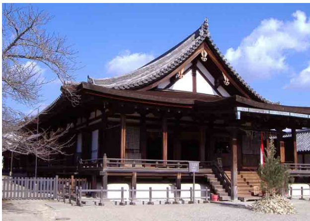
Старинный японский храм

Принципиально японские каркасные дома отличались меньшей толщиной стоек и более рыхлым заполнителем. Фундаментом служило в основном каменное основание.