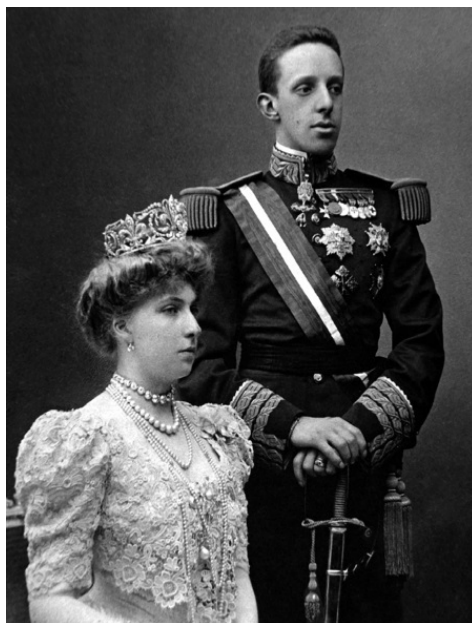
Король Испании Альфонс XIII с супругой

В 1902 г. Альфонс XIII официально вступил на испанский престол. Вместе с молодым королем в новый век перебрались и его враги – сепаратисты Каталонии и Страны Басков, а также свирепые анархисты и республиканцы всех мастей. Испанское правительство проводило либеральную политику, получившую название «революция сверху». Однако поражение испанской армии в войне с местными племенами в Марокко в 1909 г. вызвало волнения в стране. В Барселоне анархисты разгромили монастыри и храмы и вступили в вооруженное противостояние с армией.