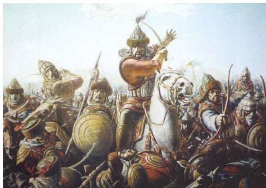
Казахи в бою.

Регулярная армия, огнестрельное оружие, артиллерия, которые стали определять мощь армий и государства в это время, были пока недоступны для степняков-кочевников поскольку для их производства требуются мануфактуры, заводы и фабрики, чего в степи, естественно, не было. Не было и технически грамотных людей. Не было отлаженных торгово-экономических связей с развитыми