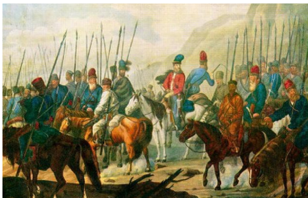
Уральские казаки XVIII века

Такая же картина была и по другим границам. Еще в середине XVII века