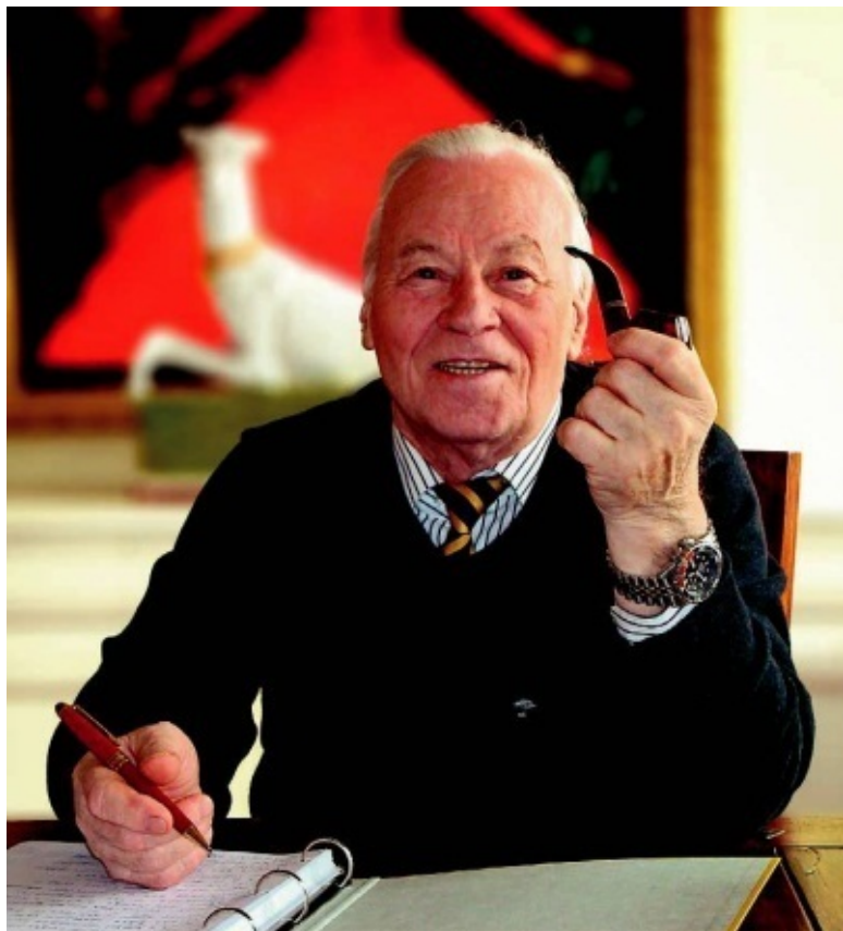
Фердинанд Фингер Фото 2010 г.