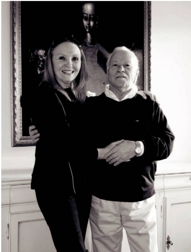
Вдвоём с женой. Фото 2010.