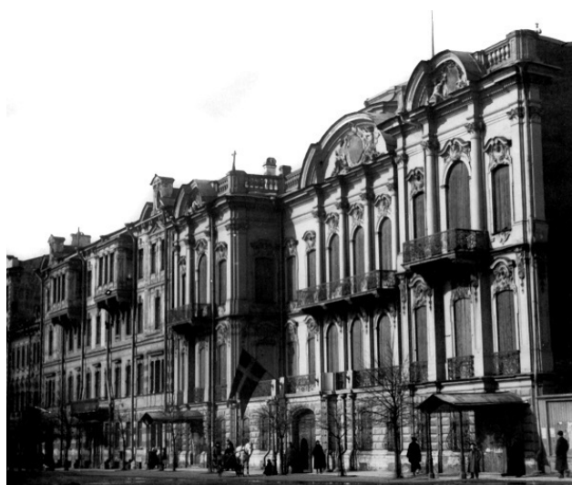
Посольство Австро-Венгрии в Санкт-Петербурге