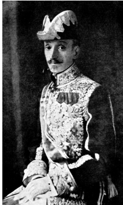
Сергей Николаевич Сербеев (13 апреля 1857, Москва – 4 апреля 1922, Берлин) – последний императорский посол в Германии в 1912–1914 гг. После революции эмигрировал в Берлин