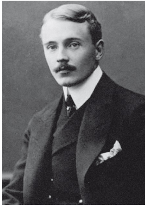
Граф Фридрих фон Пурталес (нем. Friedrich von Pourtalès; 24 октября 1853 – 3 мая 1928) – германский посол в России в 1907–1914 гг.; советник министерства иностранных дел в 1914–1918 гг.