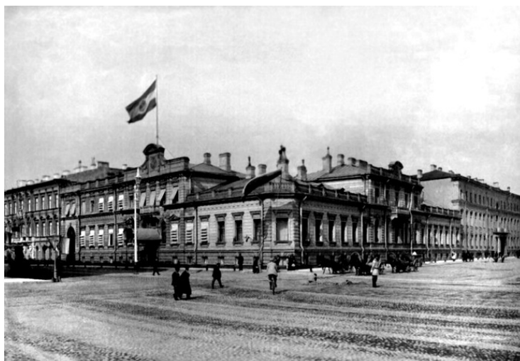
Посольство Германии в Санкт-Петербурге

Все это происходило внутри России, а вне ее, за ее пределами, вся тяжесть работы с беженцами легла на заграничные представительства Министерства иностранных дел.