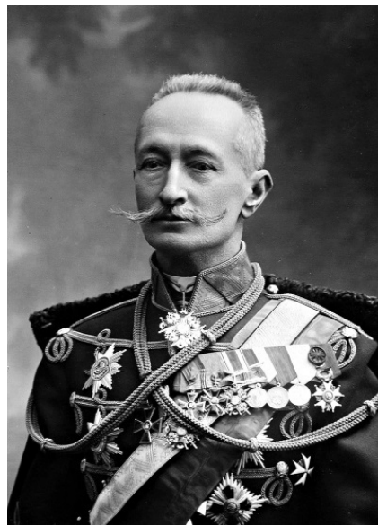
Алексей Алексеевич Брусилов (19 августа 1853, Тифлис – 17 марта 1926, Москва) – главнокомандующий войсками Юго-Западного фронта (1916 г.)