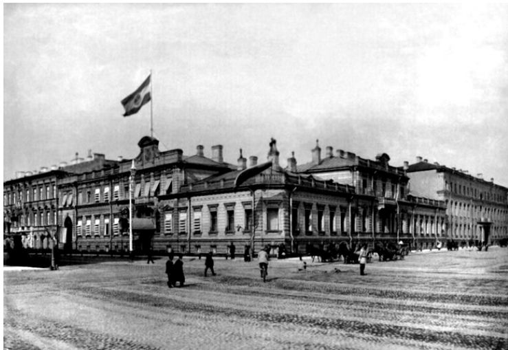
Посольство Германии в Санкт-Петербурге

Все это происходило внутри России, а вне ее, за ее пределами, вся тяжесть работы с беженцами легла на заграничные представительства Министерства иностранных дел.