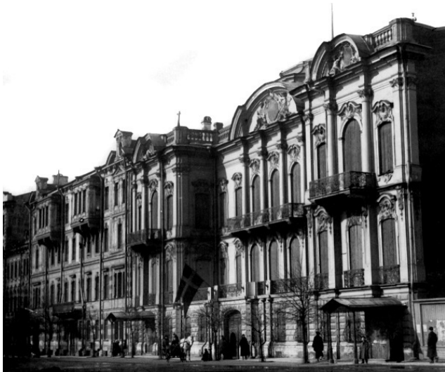
Посольство Австро-Венгрии в Санкт-Петербурге