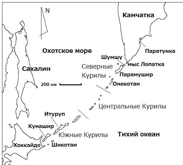
Рис. 2. Южная часть полуострова Камчатка и близлежащие территории

Это говорит о том, что на Северных Курилах жили точно такие же айны, как и на Южных, то есть, Курильские и Камчатские айны составляют одну группу внутри айнской народности. При этом айны Южных Курил больше общались с айнами Хоккайдо, а айны Северных и Центральных Курил с айнами Камчатки.