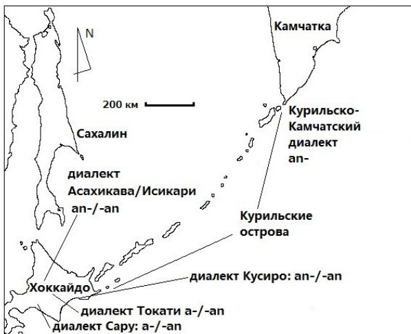
Рис. 4. Географическое распределение показателей неопределенного агенса в различных айнских диалектах: видна близость Курильско-Камчатского диалекта диалектам восточного Хоккайдо

Видно, что Курильско-Камчатский диалект достаточно близок диалектам Асахигава/Исикари и Кусиро, где неопределенный агенс выражен следующими показателями: ap-/ap , что достаточно близко Курильско-Камчатскому диалекту, в то время как формы a-/ap , существующие в диалектах Токати и Сару, более далеки форме существующей в Курильско-Камчатском диалекте; в диалектах Сахалина такая категория как неопределенный агенс не фиксируется (см. рис. 4).