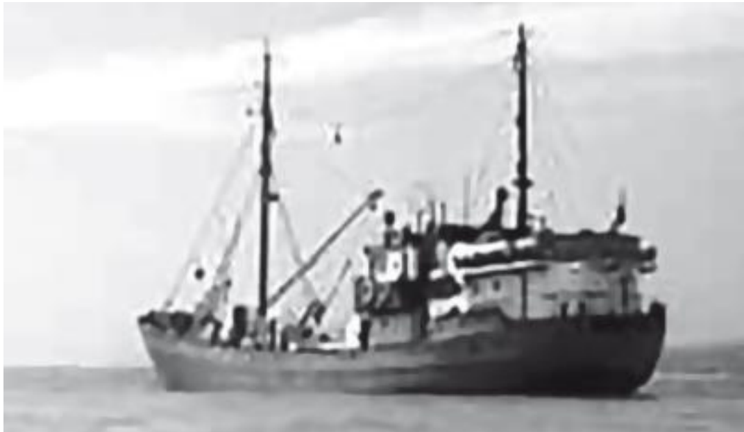
СРТ, средний рыболовный траулер