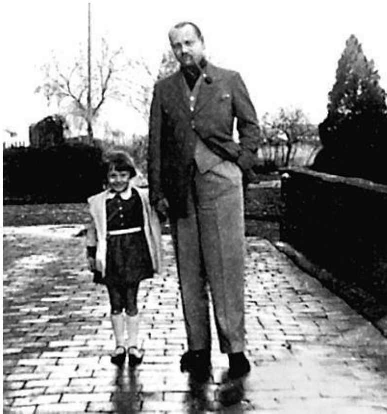
Редкое фото – Одри с отцом