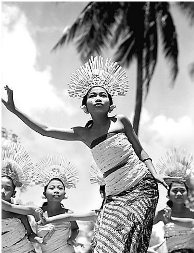
Девушки Индонезии. Снимок фотографа из Голливуда