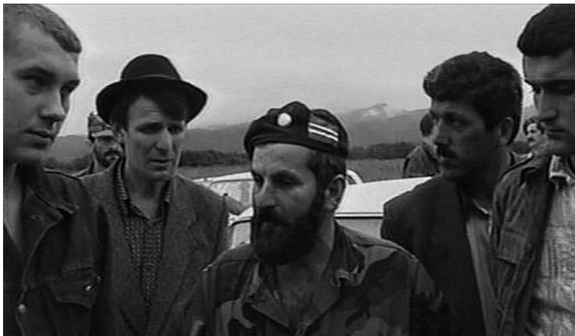
Кадр из видеоролика, отснятого боевиками