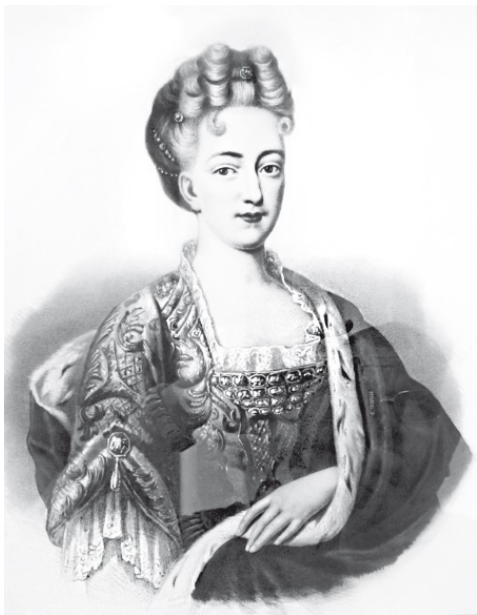
Шарлотта Кристина София

София Шарлотта своей матери. – Я бы нисколько не дорожила жизнью, если бы могла ее принести ему в жертву или этим доказать ему мое расположение, и хотя я имею всевозможные поводы опасаться, что он меня не любит, – мне кажется, что мое расположение от этого еще увеличивается...».