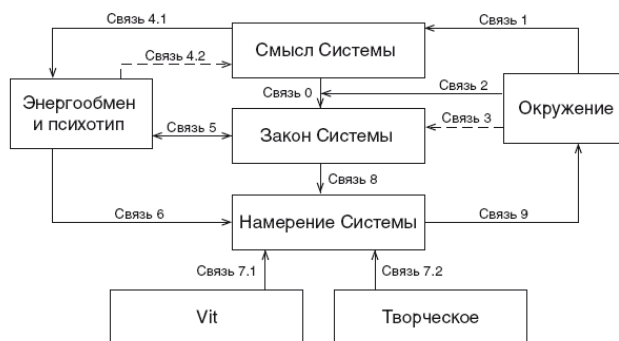
Рис. 2. Структурная схема программирования будхиального тела

Сознание человека – это программа, основанная на математической модели. Любую модель можно увидеть, описать и понять. Для этого есть специальная форма – описание в виде структурной схемы. Метод удобный и уже почти универсальный, поэтому применим его для более глубинного понимания. В дальнейшем вам придётся работать с этой моделью очень основательно.