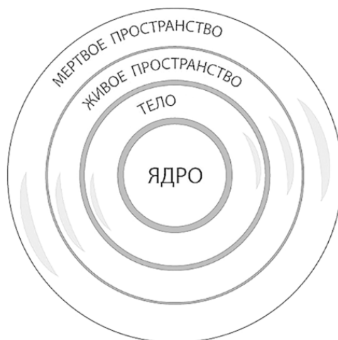
Рис. 1. Структура будхиального тела и эгрегора

Эгрегориальная система всегда будет стараться не дать раскрыться ядру в полном объёме, поскольку с такой конфигурацией сознания человек сам становится подобен эгрегору, приобретает сознание мага и получает способность взаимодействовать с информационными разумами богов напрямую и без посредников. Не давать раскрыться ядру сознания эгрегоры мира человеческого могут разными способами, вплоть до подмены всего будхиального тела. Но самый простой (и поэтому распространённый) метод – это не дать возможности энергии разума человека быть направленной на ядро. А без энергии никакая информация распаковаться не может.