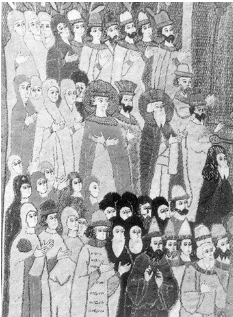
Изображение семьи Ивана III на шитой пелене того времени

Тема отступничества стала особенно актуальной в 1492 2 году, когда, согласно христианскому исчислению, окончились семь тысяч лет от сотворения мира. Час пришел, а предсказываемый конец света почему-то не наступал, что дало повод к еретическим мыслям, сомнениям в вере, превратным толкованиям Библии. «Если бы Христос был Мессией, – говорили сектанты православным, – то почему же он не является в славе, по вашим ожиданиям?» Понятно, что это было весомым аргументом в пользу учения еретиков.