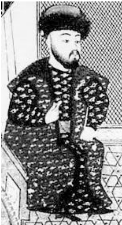
Крымский хан Менгли-Гирей. Османская миниатюра XVI в.

Иван III вел длительную переписку и еще с одним жителем Кафы, которого считал евреем – с Гизольфи Заккарией (или Захарией). Тот писал великому князю в 1483 году о взя-